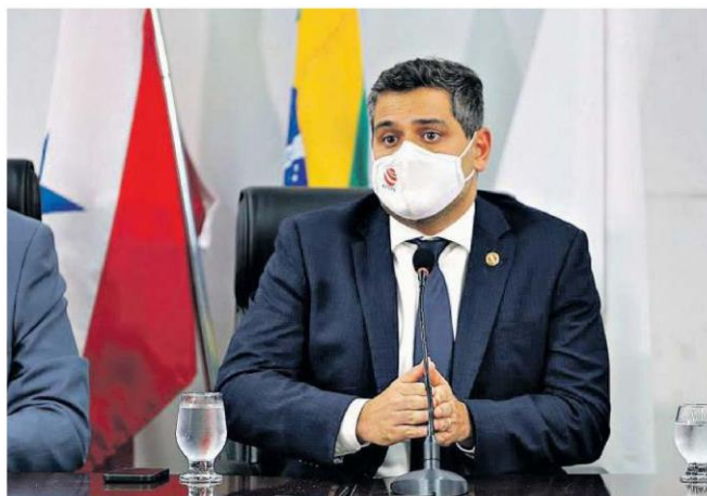
Segundo Ricardo Sefer, Constituição garante vagas a mais pelo número de habitantes

De acordo com a Constituição Federal de 1988, a representação popular na Câmara dos Deputados deve ser proporcional à população de cada Estado, devendo essa proporcionalidade ser ajustada no ano anterior às eleições. Em 1993, no entanto, foi editada a Lei Complementar n.º 78, que fixou o número de deputados federais, porém nada foi disposto sobre a