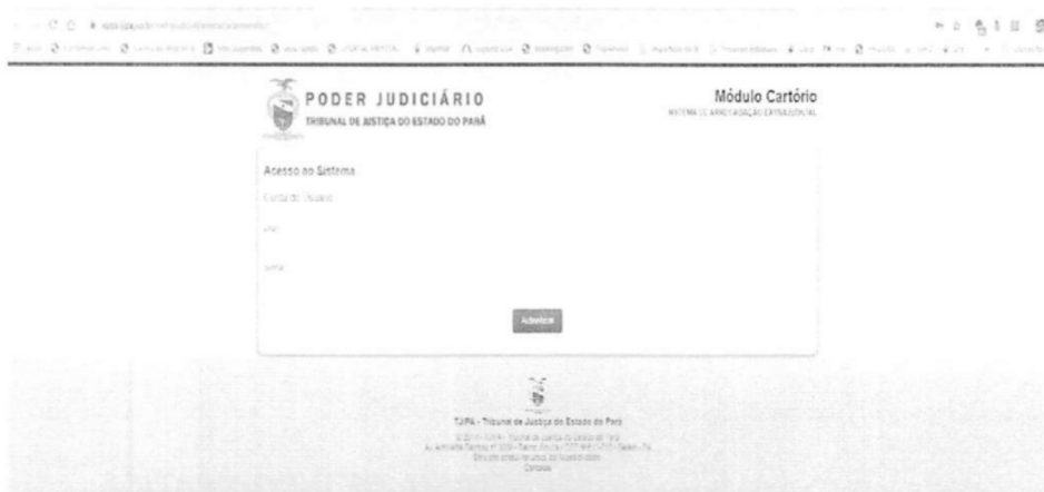
FIGURA 2 - TELA DE AUTENTICAÇÃO DA FERRAMENTA DE VENDA DE SELOS

Ao abrir a ferramenta, o cartório fará uso de seu usuário e senha que já utiliza normalmente para a aquisição de selos, conforme pode ser visualizado na figura 2: