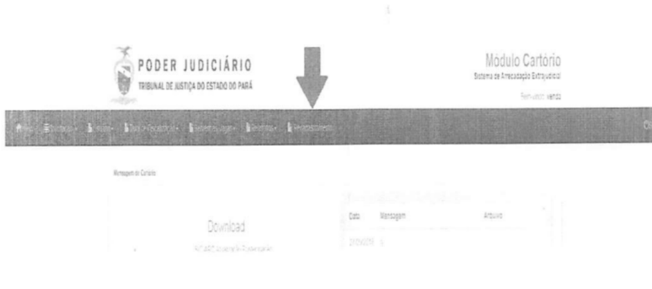
FIGURA 3 - INDICAÇÃO DO RECADASTRAMENTO COMO FUNCIONALIDADE.

No menu de opções de funcionalidades do aplicativo, irá aparecer a opção de Recadastramento, conforme pode ser visualizado na figura 3.