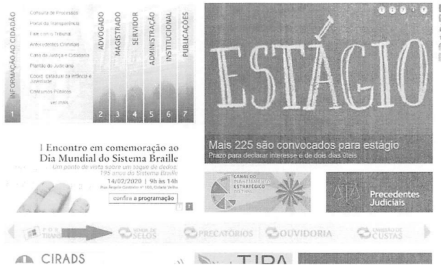
FIGURA 1 - PORTAL DO TJPA COM DESTAQUE A FERRAMENTA DE VENDA DE SELOS

A ferramenta de cadastro de cartórios já está disponível no ambiente de vendas de selo no site do TJPA conforme pode ser visualizado no destaque da figura 1: