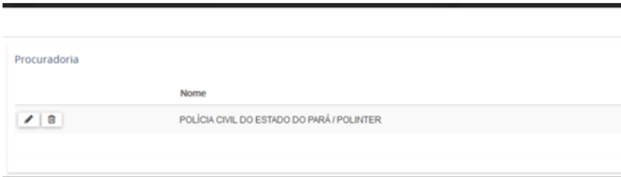
Figura 1 – Print de tela do sistema PJE indicando a Procuradoria da POLINTER no sistema PJE do TJPA.

Cientifique a Presidência desta Côrte, o Núcleo de Cooperação Judiciária (este último, atentando quanto às demandas de outras unidades federativas) e o Delegado-Geral da Polícia Civil do Pará .