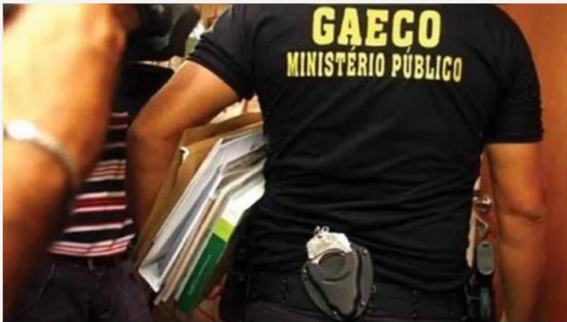
Membros do Gaeco em ação

Grupos criminosos são retratados no cinema como máfias se tem como seio a família. Os núcleos onde membros vêm de uma conduta fora da lei, no entanto, não é uma singularidade das artes. Na vida real eles também existem.