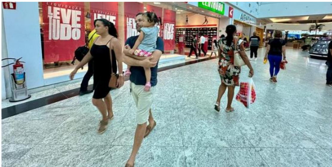
Paraenses devem atentar para as mudanças no funcionamento de lojas e outros estabelecimentos no feriado da Sexta-Feira Santa

25.03.24 18h35 -Atualizado em 26.03.24 10h00