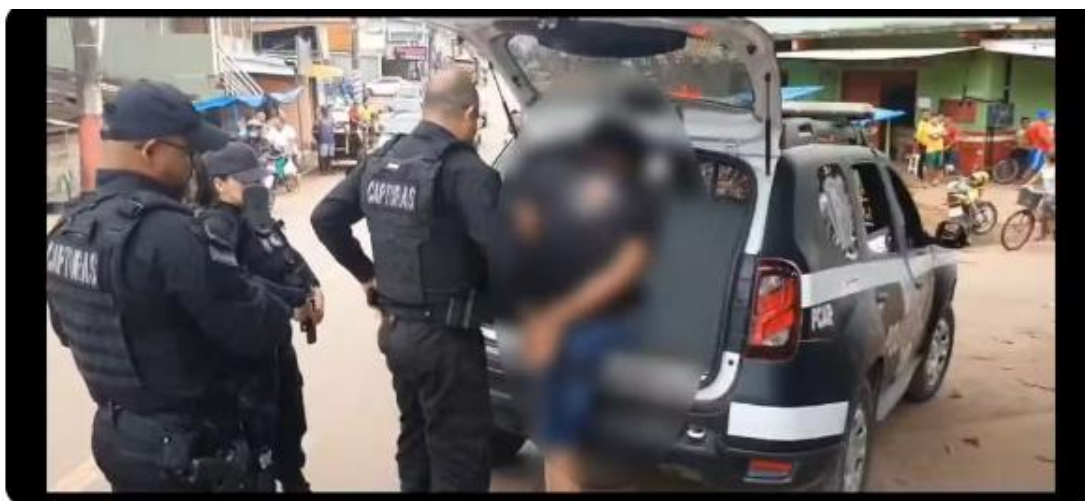
Homem foi preso nesta sexta-feira (22) na Zona Sul de Macapá.

25/03/2024 13h14 · Atualizado há 21 horas