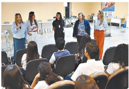
Alunos e alunas dialogaram com a equipe da Cevid sobre as formas de violência previstas na Lei Maria da Penha