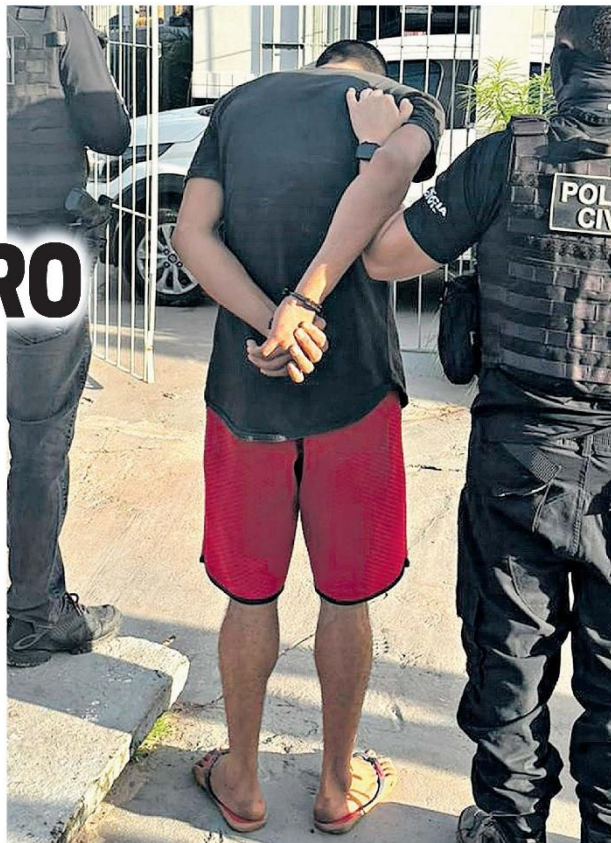
O suspeito confessou a autoria do crime, segundo a polícia.

Além do celular, a polícia apreendeu a camiseta que o autor utilizou no dia do crime. No celular do suspeito,