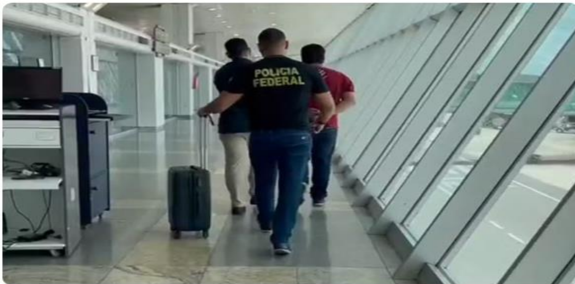
Condenado por estuprar filha e fugir para a Espanha é preso ao desembarcar no aeroporto de Belém.

Um passageiro condenado por estuprar a própria filha adolescente foi preso nesta sexta-feira (8) pela Polícia Federal ao desembarcar no Aeroporto Internacional de Belém .