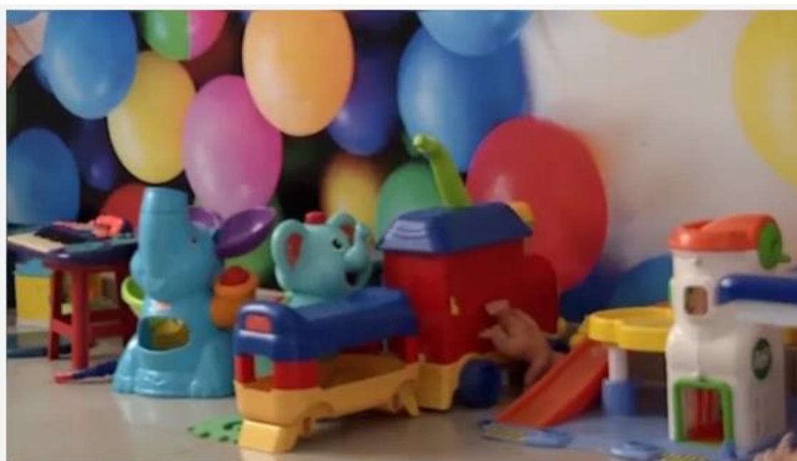
Abuso foi denunciado por vítima para os pais

Uma professora de ensino infantil foi presa após denúncia de abuso sexual contra uma criança no município de Faro, Oeste do Pará. O fato foi descoberto depois da vítima, de três anos, contar aos pais sobre o abuso.