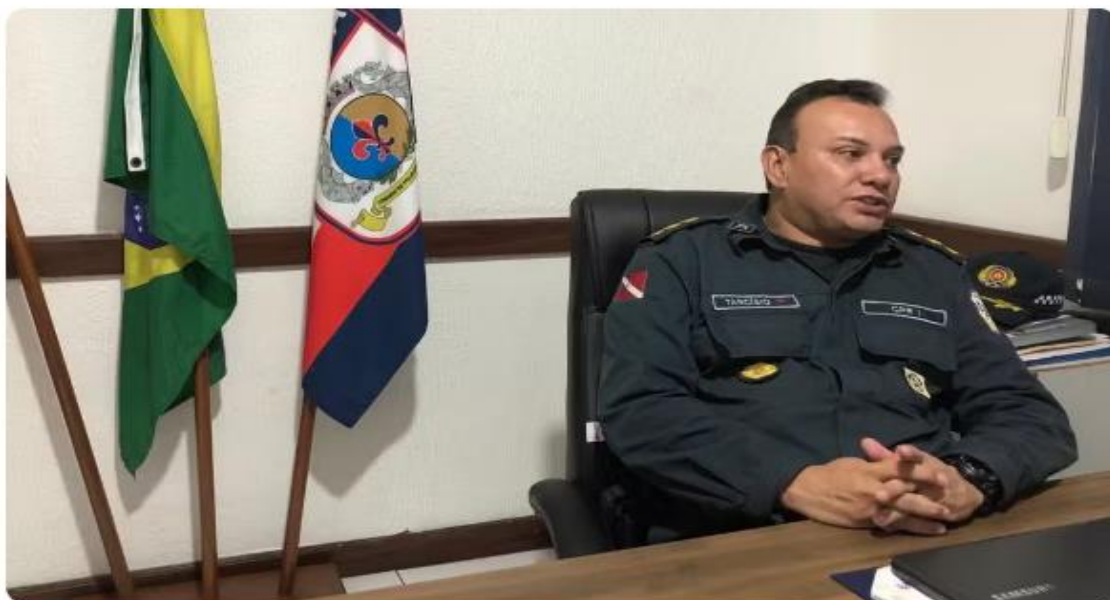
Coronel Tarcísio de Freitas destaca sobre o balanço da operação na região

A quarta ação da Operação Força Total, coordenada pelo Conselho Nacional dos Comandantes Gerais e realizada em todo o Brasil, teve impacto significativo no estado do Pará. O comandante do Comando de Policiamento Regional (CPR-1), coronel Tarcísio de Freitas, destacou a abrangência da operação, que atendeu aos 144 municípios paraenses. A operação ocorreu durante todo o dia de quinta-feira (7).