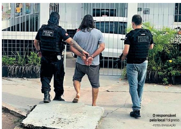
O responsável pelo local foi preso

A Polícia Civil deve dar continuidade nas investigações para saber quem eram os clientes em potencial do suspeito que tinha um mercadinho que utilizava de fachada para maquiagem o comércio ilegal de armas e de munições para arma de fogo.