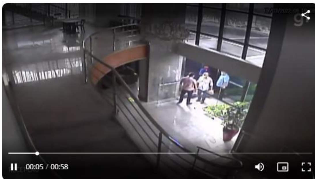
Vídeo registra briga entre vizinhos em prédio de luxo do Umarizal