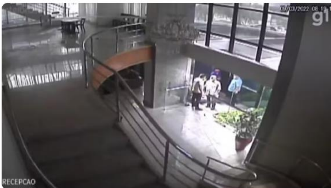
Pancadaria em prédio de luxo foi registrado por câmeras de segurança