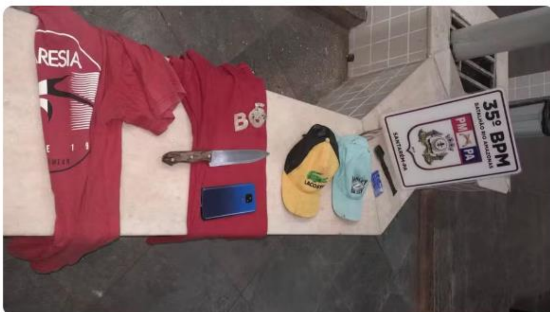
Material apreendido pela Polícia Militar durante a ocorrência de assalto em Santarém

Durante o Plantão Policial de segunda-feira (4) até a manhã desta terça-feira (5) na 16ª Seccional Urbana de Santarém, no oeste do Pará, prisões por assalto e crime ambiental foram as principais ocorrências registradas.