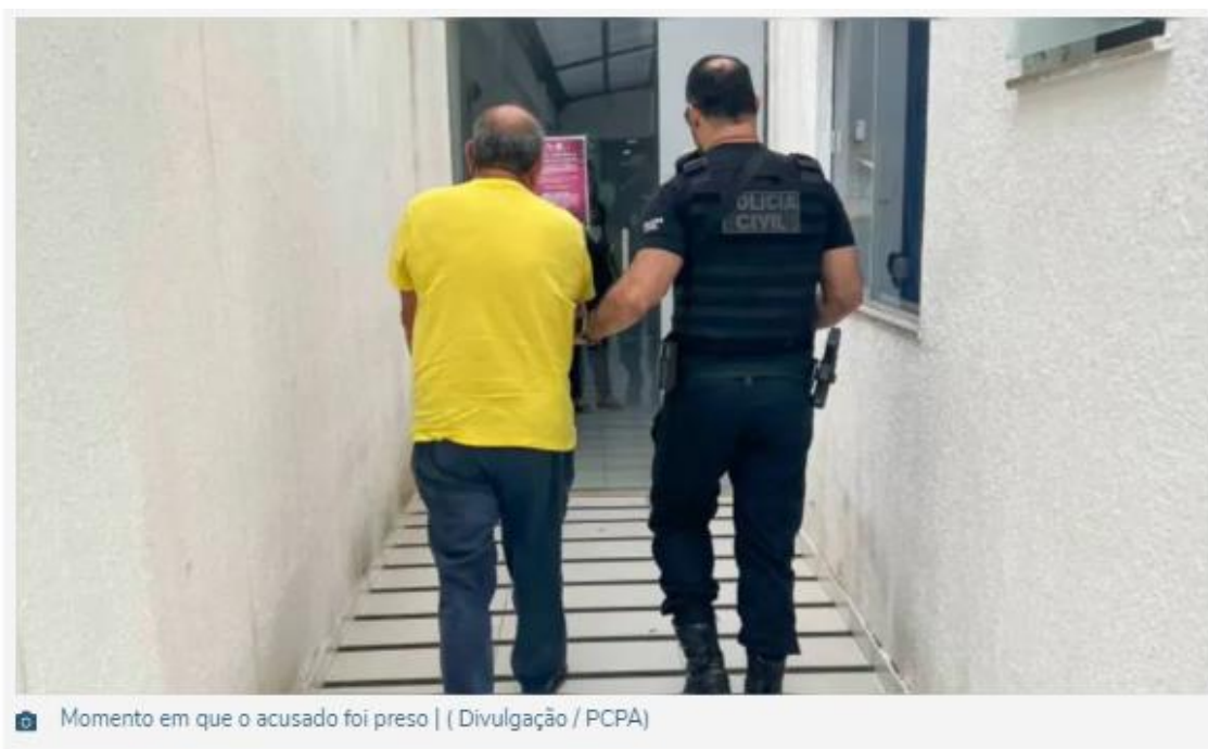
📷 Momento em que o acusado foi preso

Crimes sexuais são atos criminosos que envolvem comportamentos de natureza sexual que são ilegais e prejudiciais. Eles podem incluir uma ampla gama de atividades, como estupro, abuso sexual, assédio sexual, exploração sexual, pornografia infantil, entre outros, causando danos físicos, emocionais e psicológicos significativos.