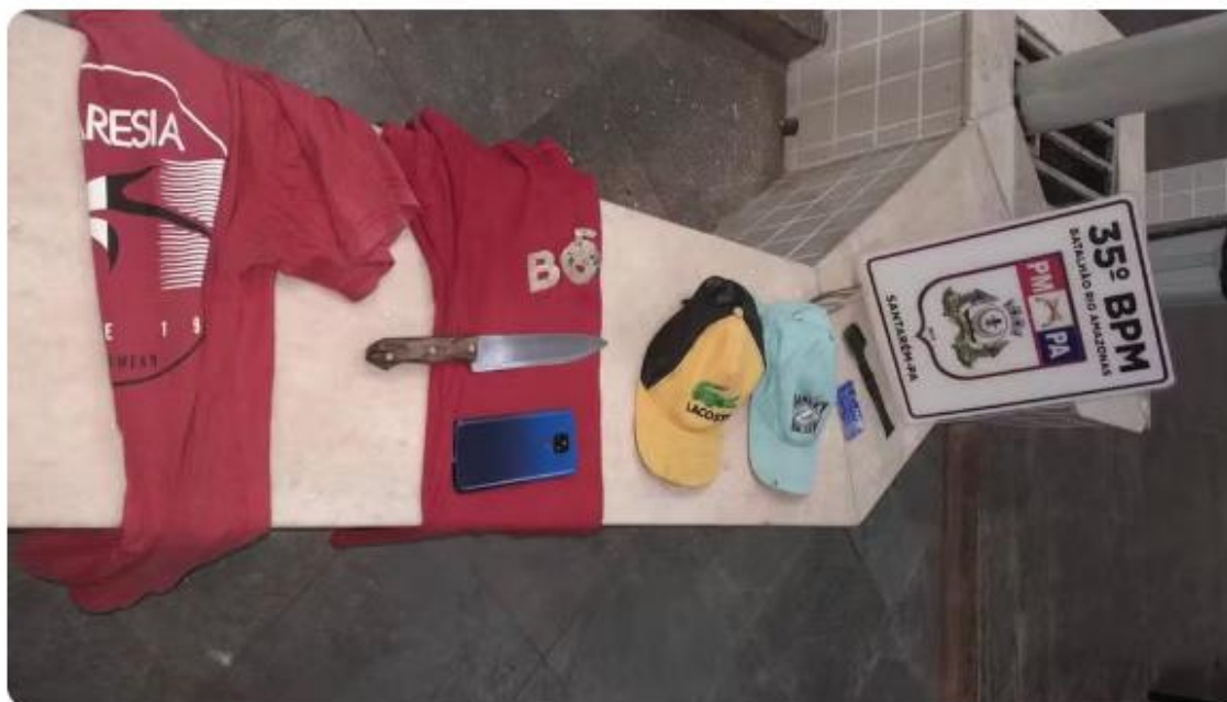
Material apreendido pela Polícia Militar durante a ocorrência de assalto em Santarém

Durante o Plantão Policial de segunda-feira (4) até a manhã desta terça-feira (5) na 16ª Seccional Urbana de Santarém, no oeste do Pará, prisões por assalto e crime ambiental foram as principais ocorrências registradas.