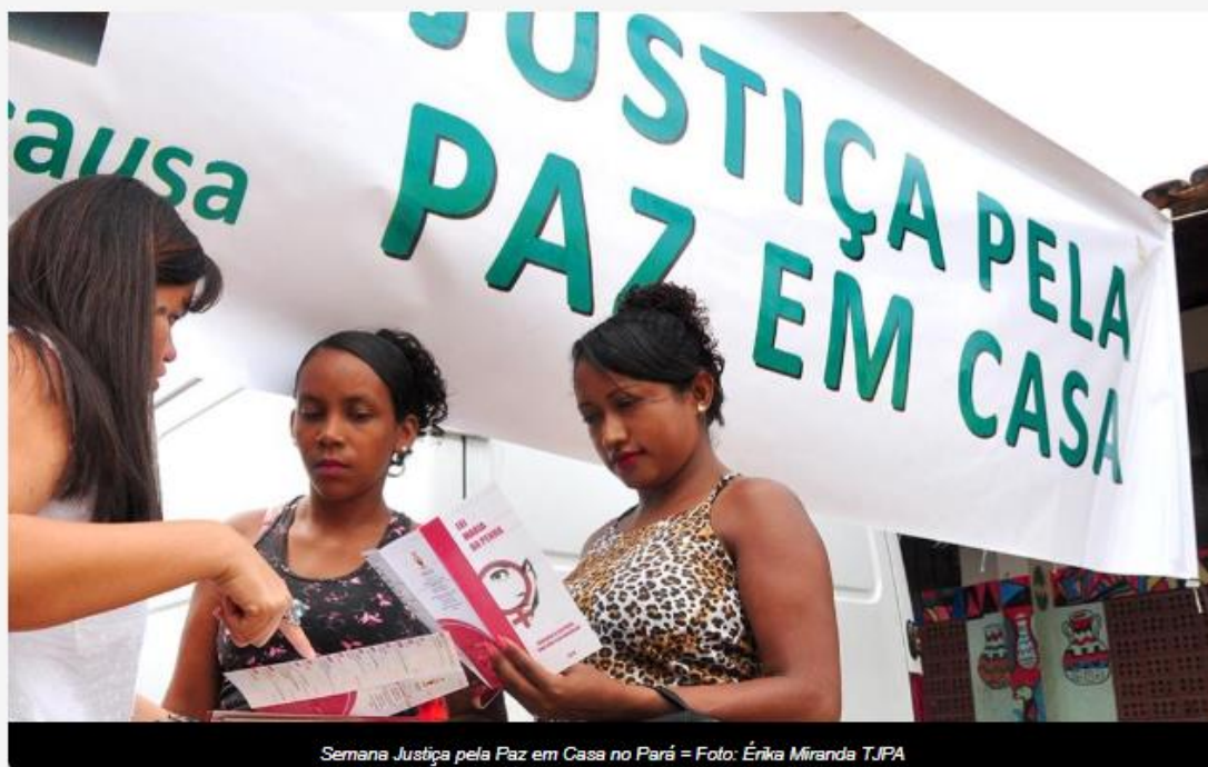
Semana Justiça pela Paz em Casa no Pará = Foto: Érika Miranda TJPA

🕒 26 de fevereiro de 2024 - 📁 Notícias do Judiciário / Agência CNJ de Notícias