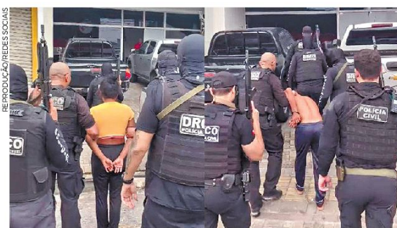
Seis pessoas já foram presas desde o início das investigações