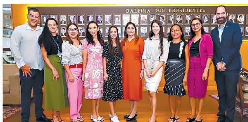
Estudantes vencedoras do concurso visitaram o edifício-sede do TJPA

O edifício-sede do Tribunal de Justiça do Pará recebeu a visita da primeira e da terceira colocadas do Concurso Estadual de Redação, promovido pelo Tribunal de Justiça do Pará em parceria com o governo do Estado, por meio da Secretaria de Estado de Educação (Seduc). O eixo temático da redação foi "Tribunal de Justiça do Pará: 150 anos garantindo acesso à justiça". O concurso oportunizou a participação de 693 escolas em 144 municípios da rede pública estadual de ensino, com mais de 1.000 inscrições de alunos e alunas do Ensino