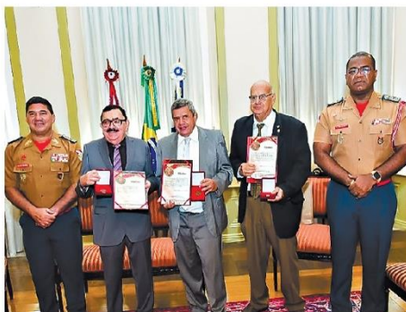
Bombeiros homenagearam os representantes do Judiciário paraense