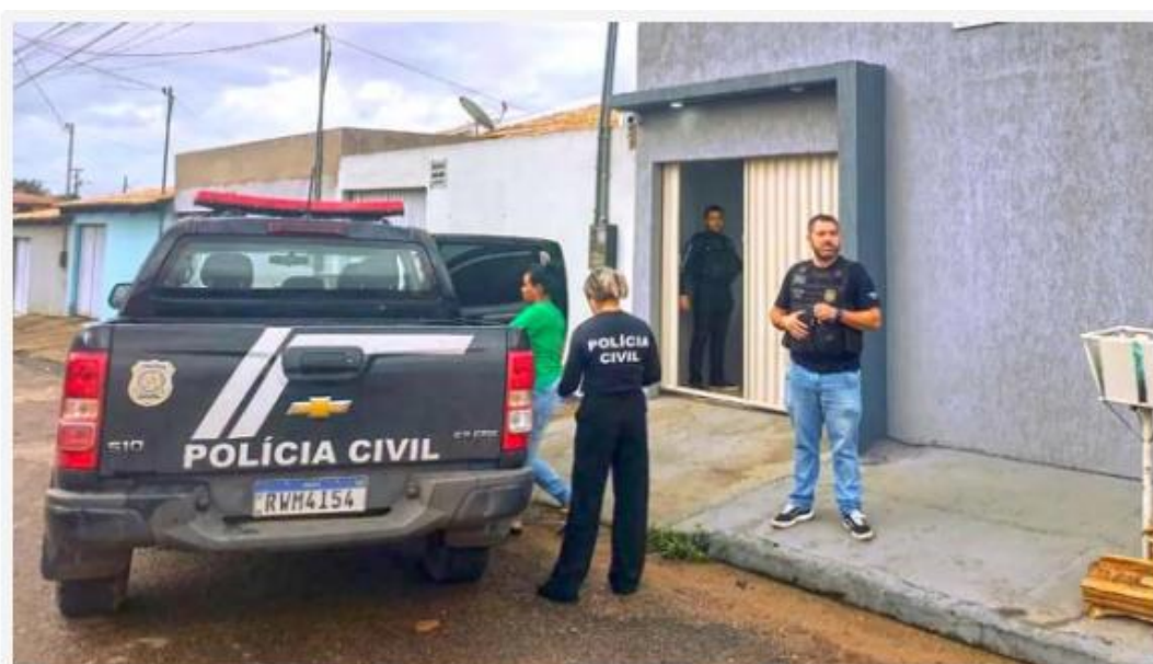
Concurso era para a Prefeitura de Parauapebas

Foram presos preventivamente na manhã desta quinta-feira (9), três mulheres e um homem, investigados na operação "Gabarito", deflagrada pela Polícia Civil do Pará, por meio da Seccional Urbana de Marabá. De acordo com a polícia, equipes da Delegacia de Homicídios de Parauapebas e do Núcleo de Apoio à Investigação de Marabá (NAI) deram apoio na ação.