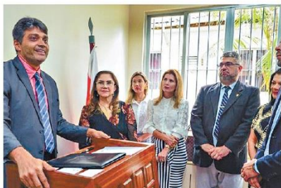
Laboratório de Inovação do TJPA chegou à Comarca de Marabá