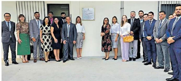
Inauguração do laboratório de Marabá ocorreu na última terça-feira (6)

O objetivo do laboratório é que seja um espaço permanente e canal de comunicação para o debate de ideias. O Pai D'égua, que tem parceria com a Escola