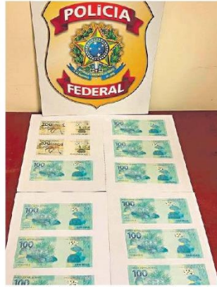
Além da prisão da mulher , a PF fez a apreensão de notas falsas resgatadas nos Correios.

Após a prisão, ela foi encaminhada ao Centro de