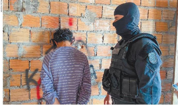
Acusado preso em flagrante era investigado desde que adolescente o denunciou por estuprá-la no Museu Goeldi

FLAGRANTE - Na casa dele, em Ananindeua, a polícia encontrou farto material de pornografia infantojuvenil armazenado em mídias eletrônicas