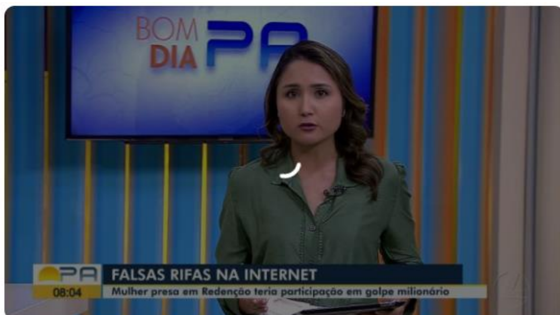
Mulher é presa em Redenção por participação em golpe milionário de rifas falsas

09/02/2024 09h42 · Atualizado há 16 minutos