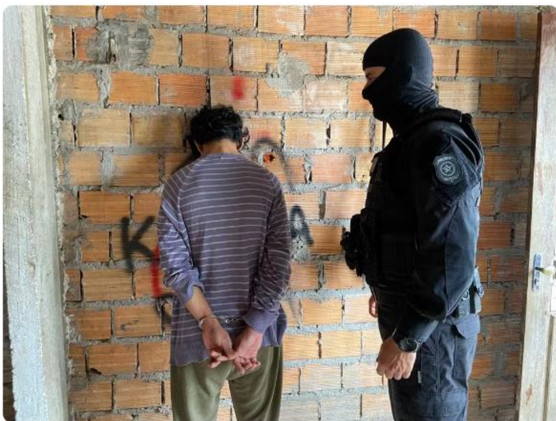
Homem suspeito de estuprar adolescente no Museu Emílio Goeldi é preso.

08/02/2024 17h15 · Atualizado há 15 horas