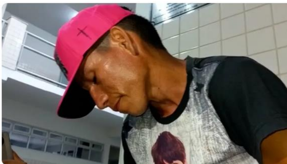
Na delegacia o suspeito disse que agiu motivado por ciúmes

06/02/2024 15h41 · Atualizado há 19 horas