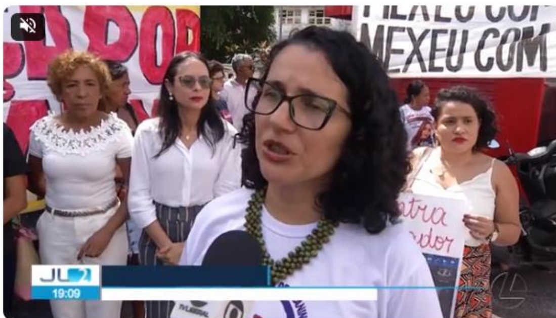
Justiça realiza 1ª audiência de instrução de jovem baleada por PM no Pará

Por g1 Pará e TV Liberal — Belém 06/02/2024 21h12 · Atualizado há 14 horas