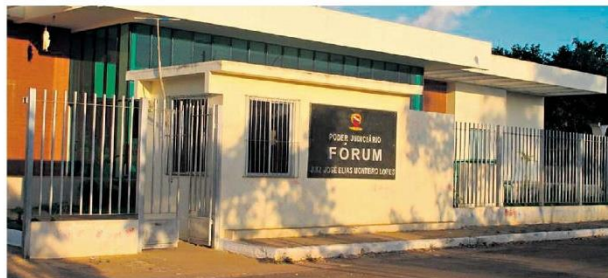
Julgamento está acontecendo no Fórum de Marabá durante toda esta quinta-feira (1º)

A partir deste detalhe a Divisão de Homicídios de Marabá, à frente do delegado Ivan Pin-