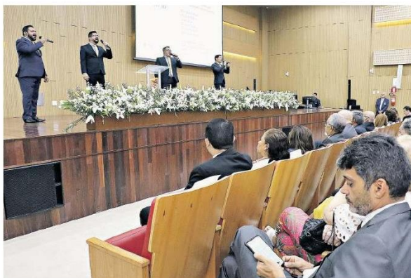
Cerimônia religiosa contou com a presença de juízes, desembargadores e servidores do Tribunal

"Os 150 anos do Tribunal de Justiça do Estado do Pará são um momento de grande importância, não só para o Judiciário, como para toda a sociedade paraense. Ao longo dos 150 anos, muitas coisas foram feitas, muitas pessoas iniciaram e estão aqui hoje. A conquista maior é a vida, é o agradecimento a Deus por estarmos aqui. Amanhã (hoje) terá uma missa na Catedral Metro-