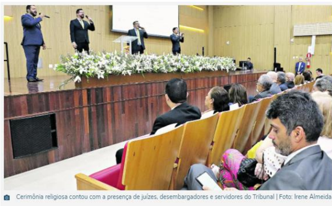
Cerimônia religiosa contou com a presença de juízes, desembargadores e servidores do Tribunal

O Tribunal de Justiça do Estado do Pará (TJPA) completará 150 anos de instalação amanhã (3) e a programação oficial para celebrar a data foi aberta ontem (1º) com um culto em ação de graças no Auditório Desembargadora Maria Lúcia Gomes Marcos dos Santos, na sede do Tribunal, em Belém. Magistrados e servidores públicos participaram do evento, que foi celebrado pelo pastor Davi Nascimento.