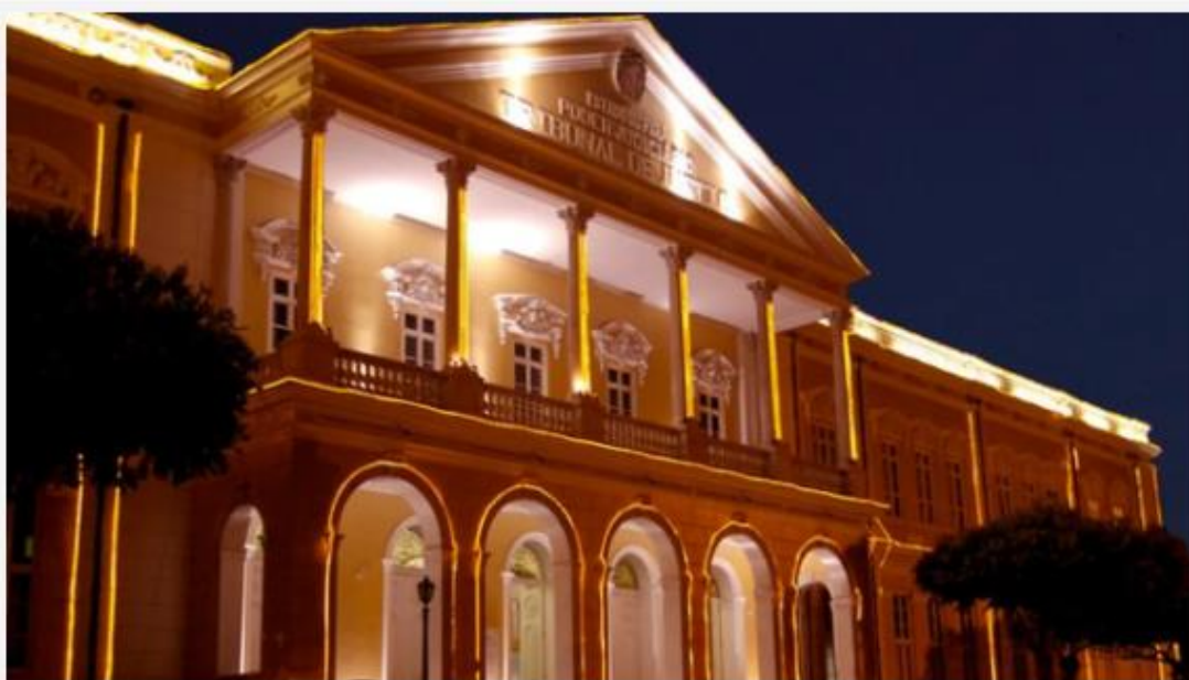
TJPA é uma das instituições mais tradicionais do Estado | (TJPA)

Uma importante instituição está celebrando um marco histórico, com mais de um século de atuação no Pará e muitos serviços ofertados à população.