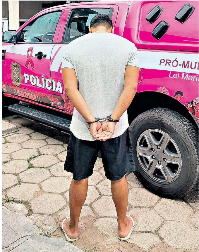
Contra o acusado havia um mandado de prisão aberto por tentativa de feminicídio, ocorrido em Terra Alta

O agressor vai ficar custodiado em regime inicialmente fechado até outra decisão do Poder Judiciário. A Polícia Civil não revelou a motivação e nem como o homem teria tentado matar a própria companheira.