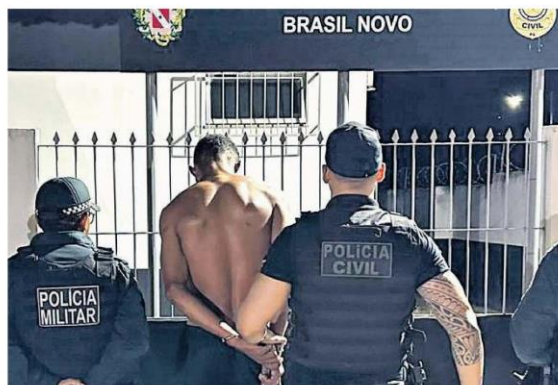
Policiais saíram às ruas na noite de última terça-feira e os trabalhos continuaram até a manhã da quarta-feira, uma resposta firme do Estado em defesa da segurança de sua população