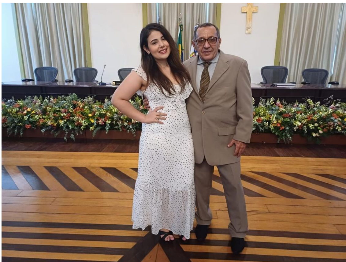
Juiz José Maria — Foto: Arquivo Pessoal