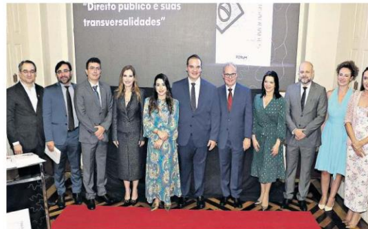
Lançamento do livro contou a presença de advogados, juristas e outras autoridades

Presente no evento, o diretor comercial da RBA Nilton Lobato falou da importância do apoio do Grupo à publicação. "O apoio do Grupo RBA e do DIÁRIO DO PARÁ a essa iniciativa do IBDPP é muito significativo. Reunir 50 personalidades do Pará e do Brasil, todas conhecedoras do Direito, para abordar uma gama ampla de temas dentro do Direito Público Brasileiro certamente oferece uma visão abrangente e atualizada para estudiosos e profissionais da área. Esta obra coordenada pela Dra. Denise Men-