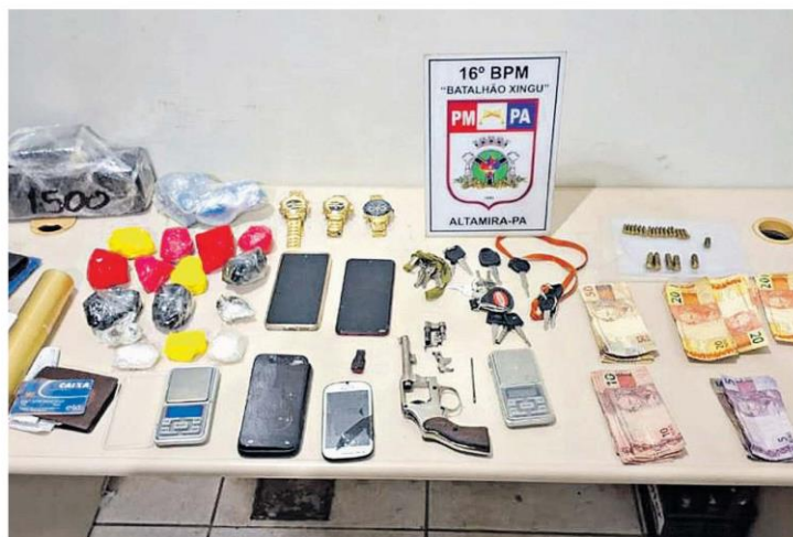
Além das prisões, houve apreensões de drogas, armas, celulares, documentos e outros objetos e materiais

Em outra residência, dois homens iniciaram a troca de tiros contra os agentes, foram socorridos para a UPA de Altamira, mas não resistiram aos ferimentos e morreram. Uma mulher e duas crianças, que eram mantidas reféns em um dos cômodos, foram resgatadas. Um homem foi atraído para o imóvel através de uma emboscada e também foi resgatado pelos policiais antes que os sujeitos o executassem. Os alvos da prisão tinham cargo de re-