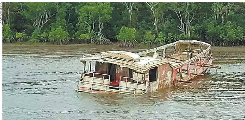
Apontado como responsável pelo naufrágio do Dona Lourdes II, comandante é formalmente réu por 24 homicídios

MARAJÓ – Ele também foi pronunciado como réu por tentativa de homicídio contra mais 62 passageiros do barco clandestino que naufragou às proximidades da ilha de Cotijuba