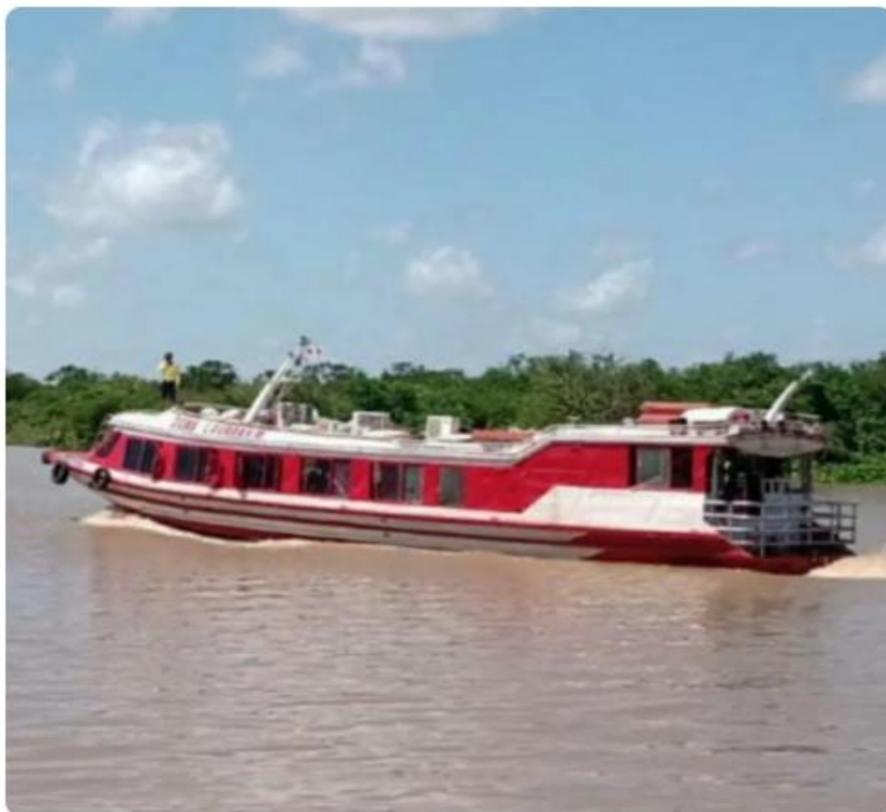
Lancha Dona Lourdes que naufragou próximo à Cotijuba, na travessia do Marajó a Belém.

O comandante da lancha Dona Lourdes II, que naufragou enquanto vinha do Marajó com rumo a Belém , foi citado formalmente nesta segunda-feira (11),