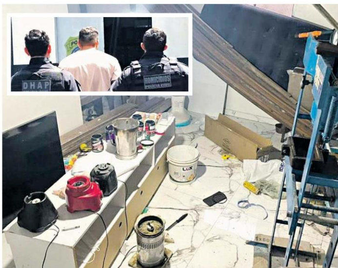
Um dos alvos foi detido em Mosqueiro e na residência do mesmo foi encontrado um laboratório para produzir drogas

“Em todo o Pará, a Polícia Civil está intensificando sua presença para fortalecer a segurança pública, visando prevenir todos os tipos de crimes, e neste caso não foi diferente. Nossos agentes estão preparados para combater os delitos e prender os criminosos. Com trabalho de forma integrada, demonstrando efetividade nas diligências, identificando envolvidos e os deixando à disposição da Justiça. Por meio dessa investigação qualificada vamos dar celeridade aos inquéritos e logo mais iremos prender os outros envolvidos no caso”, ressaltou o delegado-geral da Polícia Civil, Walter Resende.