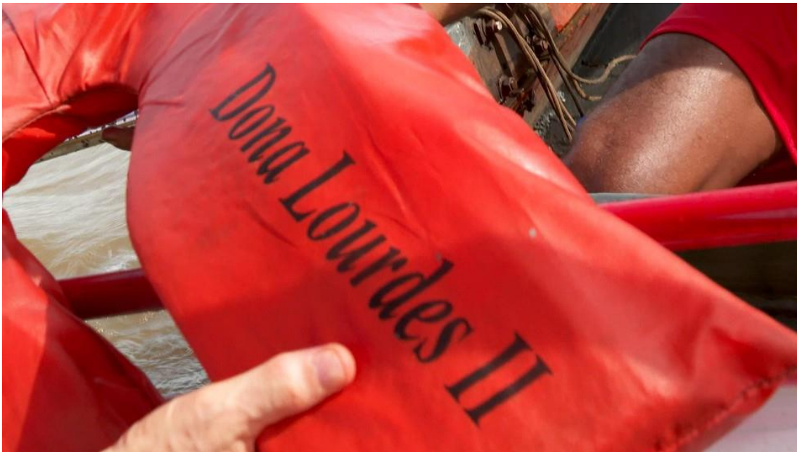
Colete salva-vidas do 'Dona Lourdes II', que foi naufragado.