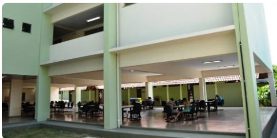
Campus Rondon, em Santarém, no Pará

Na segunda-feira (11), a Universidade Federal do Oeste do Pará (Ufopa), campus Rondon, realiza o Seminário de Digitalização de Documentos Judiciais. O evento, que tem início às 18h30, tem como objetivo compartilhar os resultados alcançados no projeto vinculado ao Programa de Arquivos Modernos em Perigo (MEAP), focado na proteção de acervos frágeis em diversas partes do mundo.