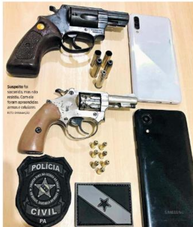
Suspeito foi socorrido, mas não resistiu. Com ele foram apreendidas armas e celulares.

Ainda de acordo com o registro, chegando na casa foi verbaliz-