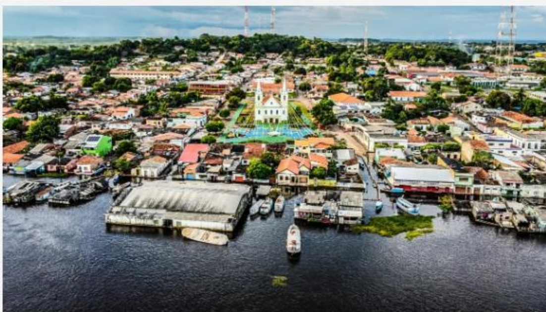
Agentes comunitários de Alenquer estão em greve desde o dia 27 de novembro

O direito universal à saúde é algo que todos os seres humanos devem possuir. Para alcançar esta meta, o poder público deve agir com vias a garantir isso e, por se tratar de um serviço público considerado fundamental, ele nunca pode parar.