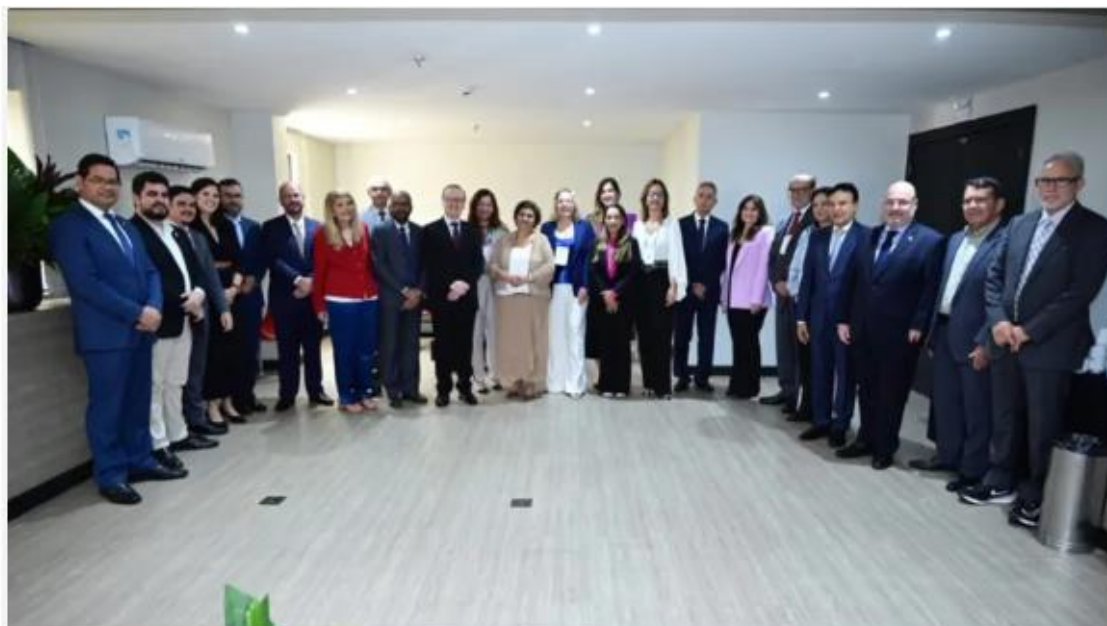
Conselheiros se reuniram em Belém nesta terça-feira (05). | (Divulgação)