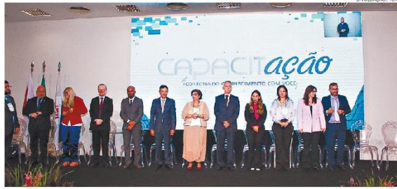
Projeto CapacitAção é realizado pelo TCMPA, por meio da Escola de Contas Públicas

CERIMÔNIA - Iniciativa busca o envolvimento e compromisso de diferentes órgãos para o tema