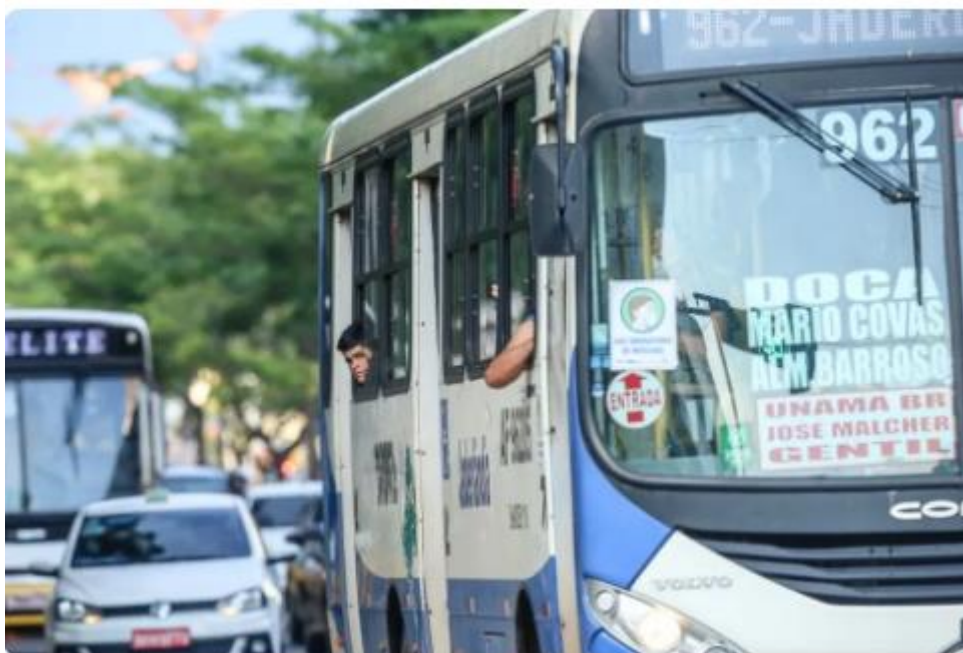
Passageiros em ônibus em Belém.

Foi reconhecido pela Justiça o acordo que prevê o novo sistema integrado de transporte público coletivo de passageiros de Belém , incluindo a aquisição de uma nova frota de ônibus com ar-condicionado para a população da Grande Belém.