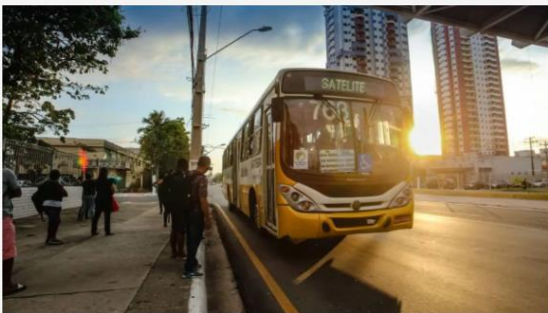
Coletivos climatizados são aguardados ansiosamente pela população paraense

Foi homologado pelo Tribunal de Justiça do Pará (TJPA) com a ciência do Ministério Público do Estado (MPE), o acordo entre o Governo do Estado, o Sindicato das Empresas de Transporte Público de Belém (Setransbel) e as prefeituras de Belém, Ananindeua e Marituba, que vai garantir o Novo Sistema Integrado de Transporte Público Coletivo de Passageiros de Belém, incluindo a aquisição de uma nova frota de ônibus climatizados para atender a população da Região Metropolitana de Belém (RMB). O acordo foi homologado nesta quarta-feira (6).