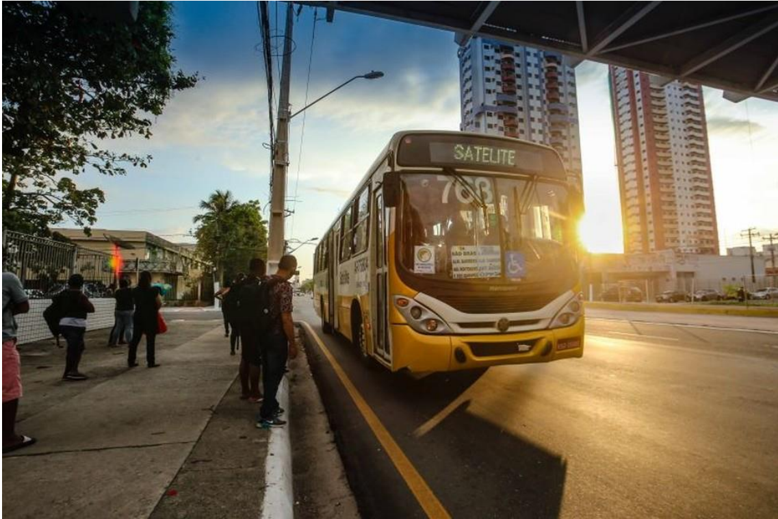
Ônibus na avenida Almirante Barroso em Belém.

O acordo ocorreu entre o governo do estado, o Sindicato das Empresas de Transporte Público de Belém (Setransbel) e as prefeituras de Belém, Ananindeua e Marituba .