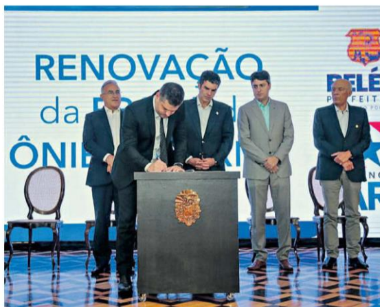
Renovação foi assinada pelo Governo do Estado, Prefeitura de Belém e Setransbel

A renovação da frota de transporte coletivo foi anunciada pelo governador Helder Barbalho no último dia 10 de outubro, em meio a um evento realizado no Palácio do Governo, em Belém, e contou com a presença do prefeito da capital, Edmilson Rodrigues, e do presidente da Setransbel, responsável pelo serviço de transporte urbano na RMB, Paulo Gomes