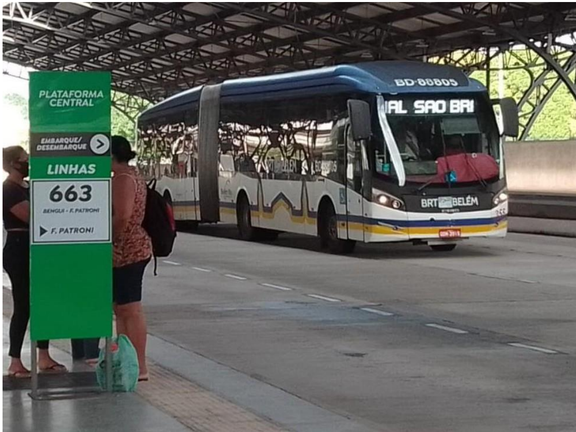
BRT em Belém.

A expectativa é que o novo sistema integrado de transporte público coletivo de passageiros de Belém faça a integração dos Sistemas BRT, que têm previsão de entrega no primeiro semestre de 2024, de acordo com o governo estadual.