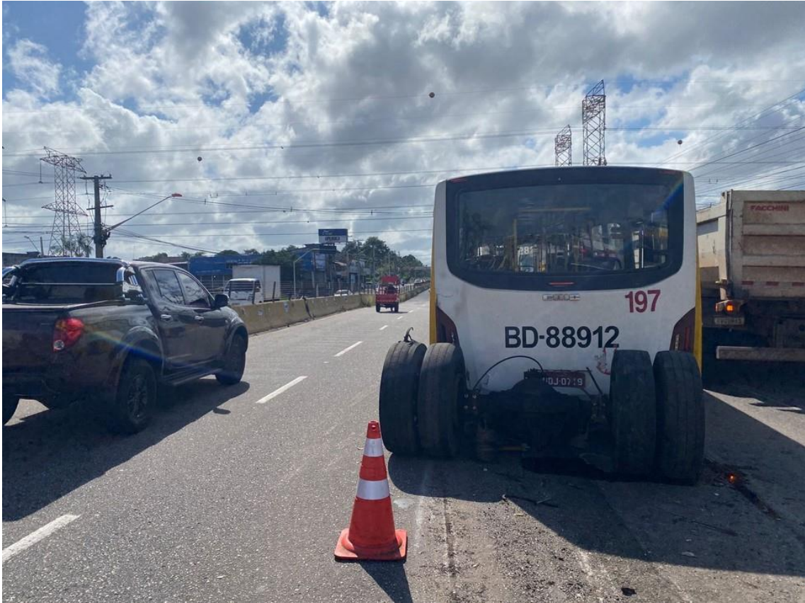
Eixo de ônibus que quebrou e assustou passageiros em Belém revela transtornos.

A partir da decisão, serão 300 veículos adquiridos pelo Setransbel; 265 ônibus elétricos pelo governo estadual e outros 130 ônibus ou 200 micro-ônibus adquiridos pela Prefeitura de Belém.