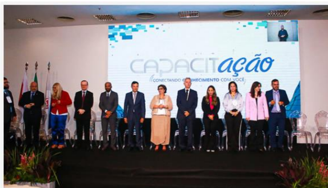
Cerimônia de abertura e assinatura do Pacto