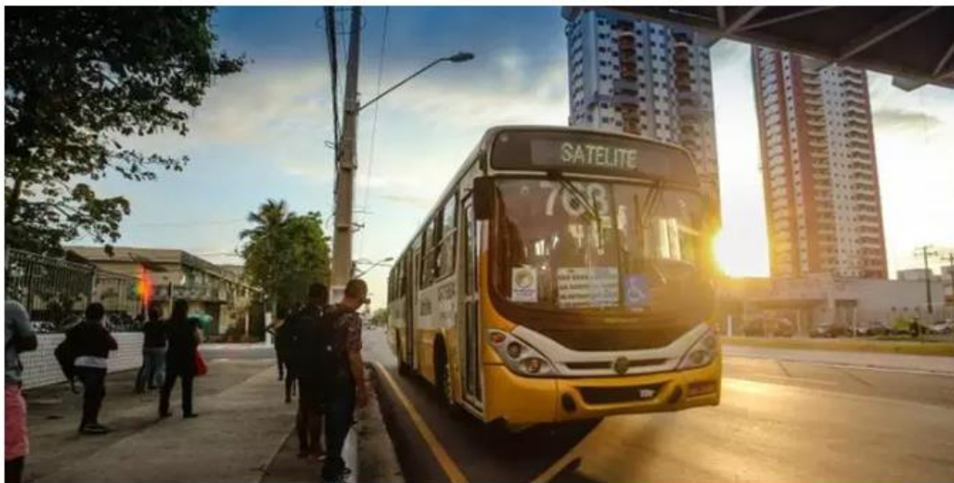
A renovação dos transportes públicos na Grande Belém já é aguardada pela população

Foi homologado pelo Tribunal de Justiça do Pará (TJPA), junto ao Ministério Público do Estado (MPE), o acordo entre o Governo do Estado, o Sindicato das Empresas de Transporte Público de Belém (Setransbel) e as prefeituras de Belém, Ananindeua e Marituba, que vai garantir o Novo Sistema Integrado de Transporte Público Coletivo de Passageiros de Belém . A medida prevê, ainda, a aquisição de uma nova frota de ônibus climatizados para atender a população da Região Metropolitana de Belém (RMB). O acordo foi homologado nesta quarta-feira (6).