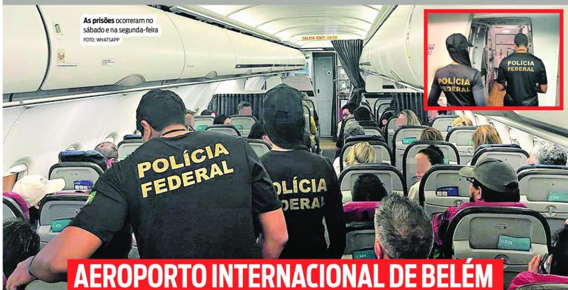
As prisões ocorreram no sábado e na segunda-feira