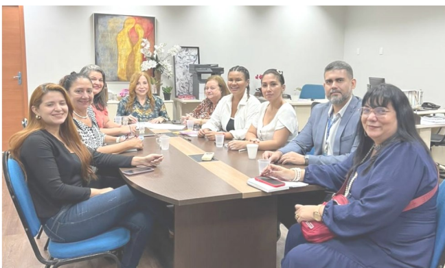
Aplicativo para combate à violência doméstica e familiar contra mulher

TJPA e Prefeitura de Belém viabilizam acordo de cooperação para lançamento do SOS Manas.