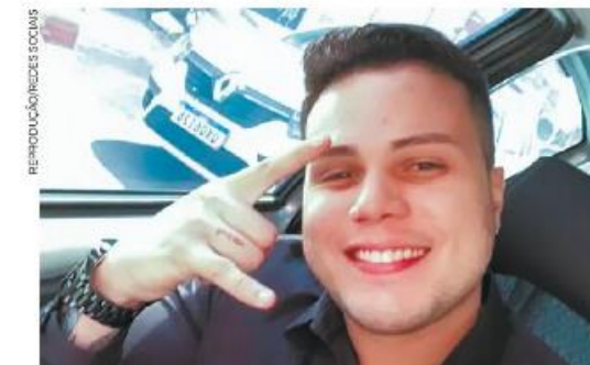
Hétero Top: agora são pai e filho encrencados com a Justiça

Além disso, o locatário, segundo a defesa, supostamente, se comprometeu a indenizar o cliente na quantia de mais de R$ 20