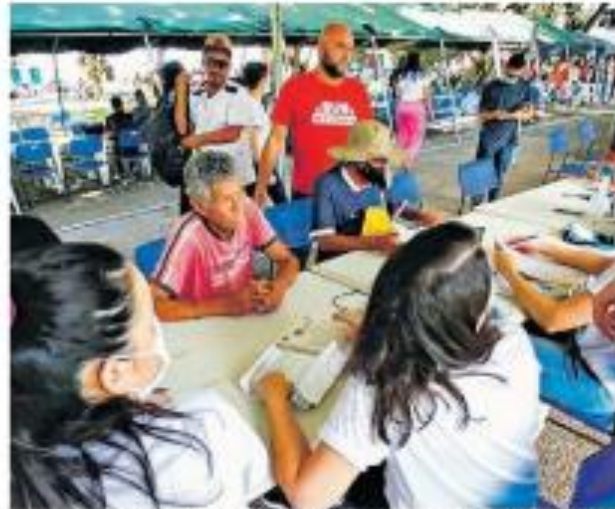
A ação "Efetivando Direitos" ocorrerá no próximo sábado, 17, na Praça da Bandeira.

A ação de cidadania oferecerá serviços como atenuação, conciliação e orientação jurídica trabalhista; serviços de saúde ( aferição de pressão, testes de glicemia, HPV, covid-19, hepatite e atendimento odontológico); vacinação (covid-19, influenza e tríplice viral); coleta de resíduos e desconto na fatura de ener-