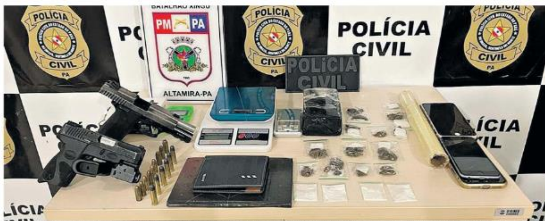
Foram apreendidas armas, munição, drogas e celulares. Policiais civis investigam a série de homicídios que vem ocorrendo desde de janeiro e que tenham como causa uma guerra de facções

Supostos faccionados reagiram a tiros à chegada de uma equipe de policiais civis e militares e acabaram alvejados no confronto. Ambos foram socorridos, mas não resistiram aos ferimentos