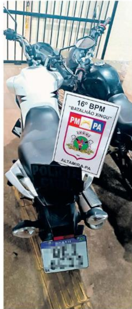
Automóveis e motos - uma as quais teria sido usada em um homicídio -, também foram apreendidos

busca e apreensão junto à comarca local, sendo concedido, e assim decretada medida cautelar. Uma equipe da Superintendência Regional do Xingu, em conjunto com o Grupamento Tático Operacional do 16º Batalhão da Polícia Militar, realizou o cumprimento, e durante a diligência, os suspeitos realizaram disparos de arma de fogo contra a equipe policial, que reagiu e efetuou quatro disparos, atingindo os suspeitos, que chegaram a ser socorridos, porém não resistiram aos ferimentos e foram a óbito.