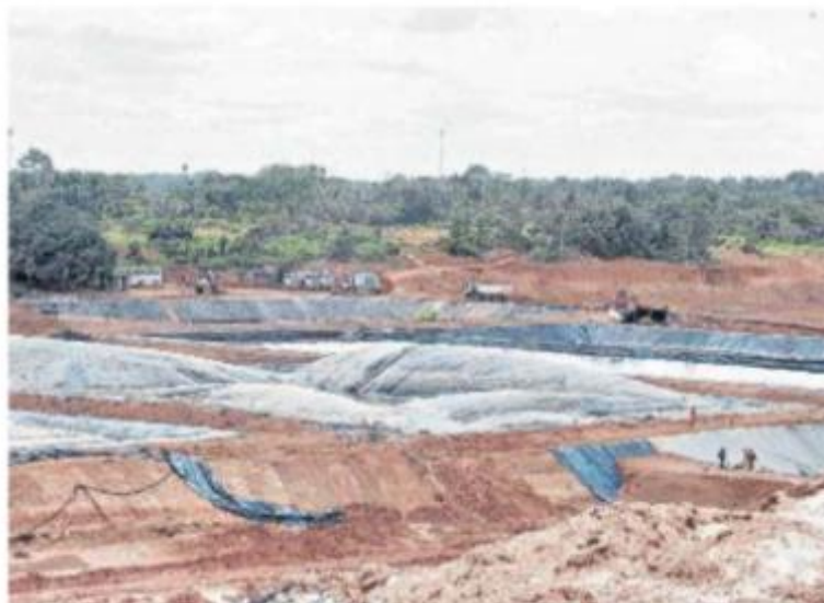
Aterro está previsto para encerrar as atividades em agosto

gião Metropolitana de Belém (RMB), oportunizando ainda que os entes públicos e as empresas participem e apresentem informações ao público. O funcionamento do aterro está previsto para encerrar em agosto de 2023.