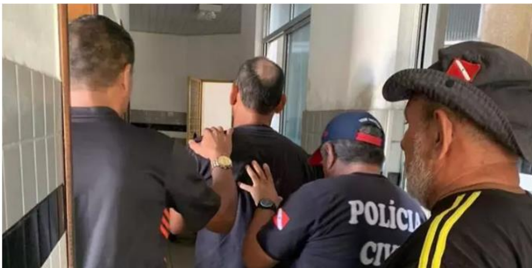
Prisão do suspeito

Um homem que não teve identidade divulgada foi preso pela Polícia Civil (PC) do Pará, na última terça-feira (13), no município de Santa Bárbara do Pará, após conclusão de investigações sobre o crime de estupro de vulnerável. As informações foram divulgadas pela própria PC.