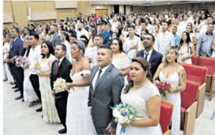
Os casais realizaram o sonho do matrimônio, na manhã de ontem, no auditório do prédio-sede do Tribunal de Justiça do Estado do Pará.

Com o tema "A Justiça em Parceria para Garantir Direitos", a VII Semana Estadual de Conciliação é promovida pelo Núcleo Permanente de Métodos Consensuais de Solução de Conflitos (Nu-