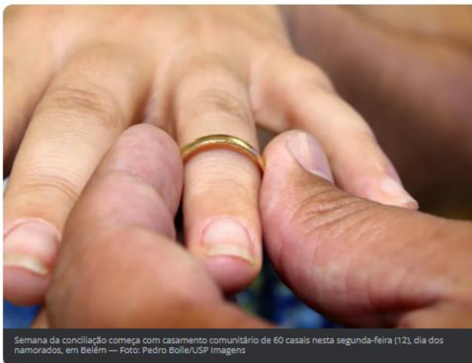
Semana da conciliação começa com casamento comunitário de 60 casais nesta segunda-feira (12), dia dos namorados, em Belém

A Semana Estadual da Conciliação oferecer serviços gratuitos em Belém até sábado (17). As atividades, realizadas pelo poder judiciário do Pará com parceiros, inicia com casamento comunitário de 60 casais nesta segunda-feira (12), dia dos namorados.