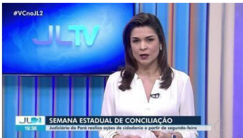
Judiciário do Pará realiza ações de cidadania no centro de Belém