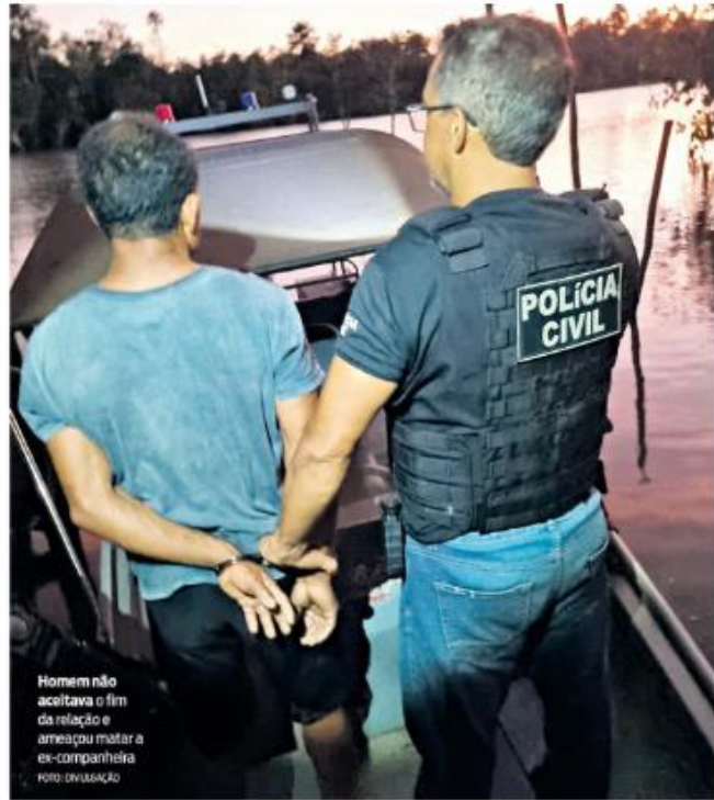
Homem não aceitava o fim da relação e ameaçou matar a ex-companheira

opiniao@dot.com.br Você gostaria de comentar? www.dot.com.br