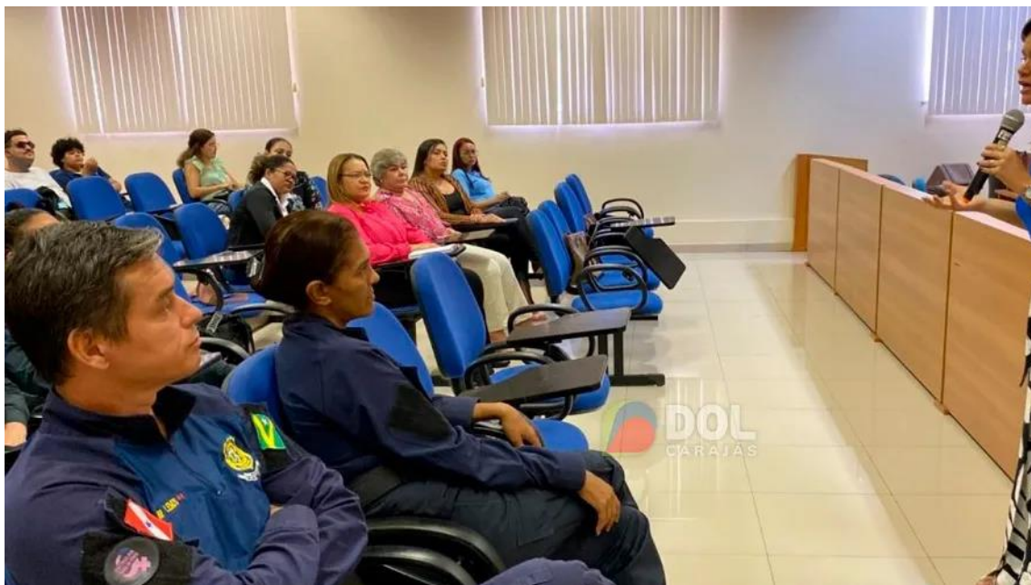
📷 Participantes acompanham atentos a palestra | Paulo Sérgio

judiciário, juntamente com a patrulha Maria da Penha que a gente saiba encaminhar elas para os órgãos necessários para que ela saia dessa violência doméstica”, afirma.