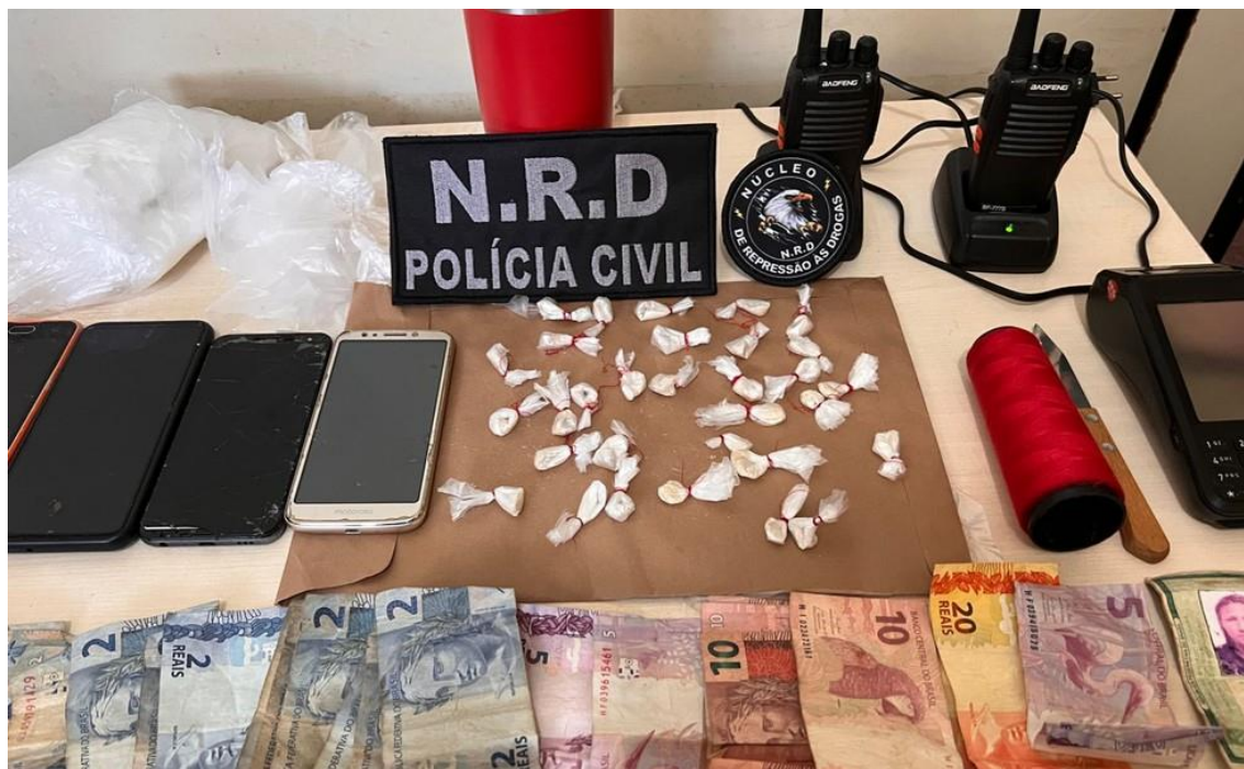
Produto oriundas do tráfico foram apreendidas

(NRD), Rodrigo Fonseca, com os suspeitos foram encontrados: dinheiro, vários aparelhos celulares, drogas, materiais para confeccionar os entorpecentes e até um rádio amador.