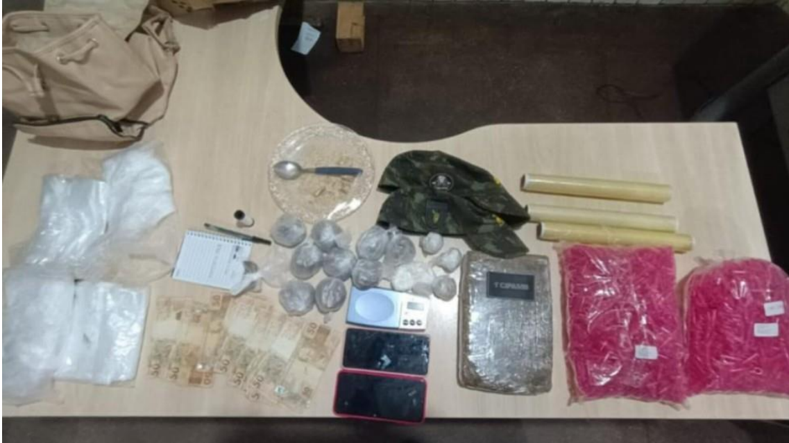
Material apreendido

Na manhã desta terça-feira (4) o juiz converteu a prisão do casal em preventiva. Todo material apreendido foi levado à delegacia para os procedimentos cabíveis. Os suspeitos foram conduzidos para a penitenciária na manhã desta terça-feira (4), mas ainda vão passar por audiência de custódia.