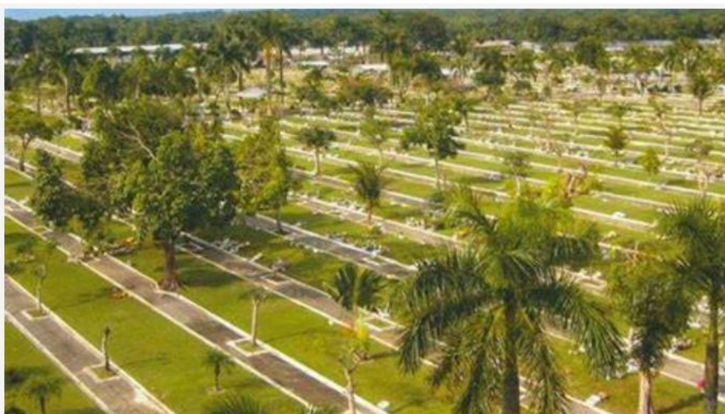
cemitério Parque da Eternidade