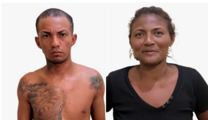
Casal preso suspeito de tráfico de drogas

Polícias Civil e Militar apresentaram na tarde e noite de segunda (3), na 16ª Seccional Urbana de Polícia Civil, dois casais e um homem suspeitos de comercializar entorpecentes. De acordo com polícia, a repressão ao tráfico de drogas na cidade é uma resposta para a sociedade que vem sofrendo com inúmeros assaltos e furtos praticados por usuários de entorpecentes.