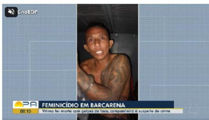
Mulher é vítima de feminicídio em Barcarena, companheiro é suspeito do crime

Uma mulher foi morta a facadas em Barcarena , . O companheiro dela é suspeito do crime e foi preso após o crime, no doingo (2). A Polícia Civil informou nesta segunda-feira (3) que investiga o caso como feminicídio.