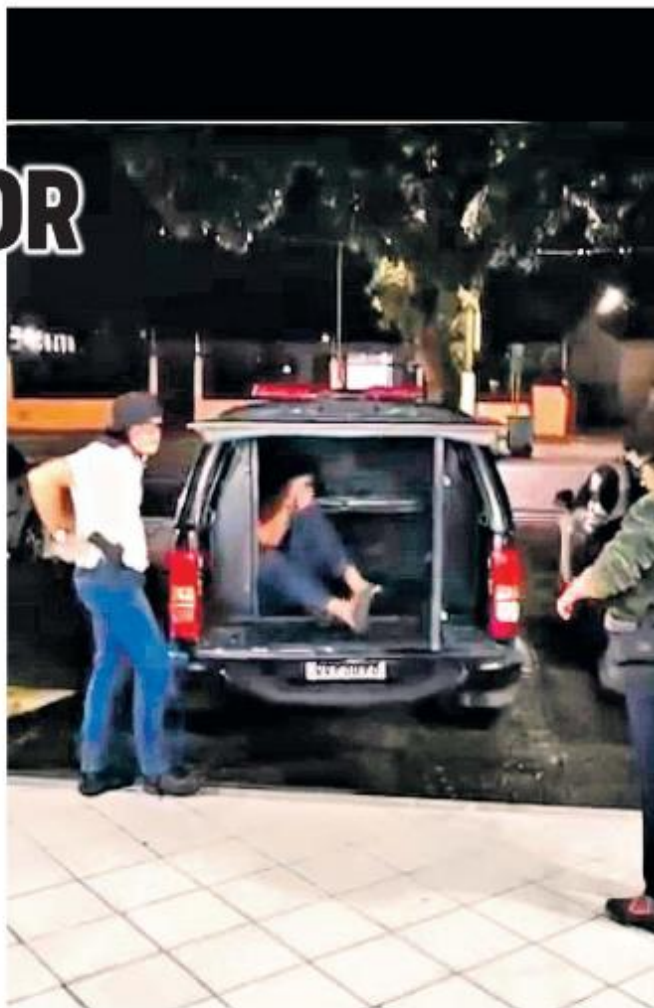
O homem foi preso pela polícia acusado de praticar ato libidinoso contra um adolescente.

opinio@dol.com.br Você gostaria de comentar? diariodopara.dol.com.br