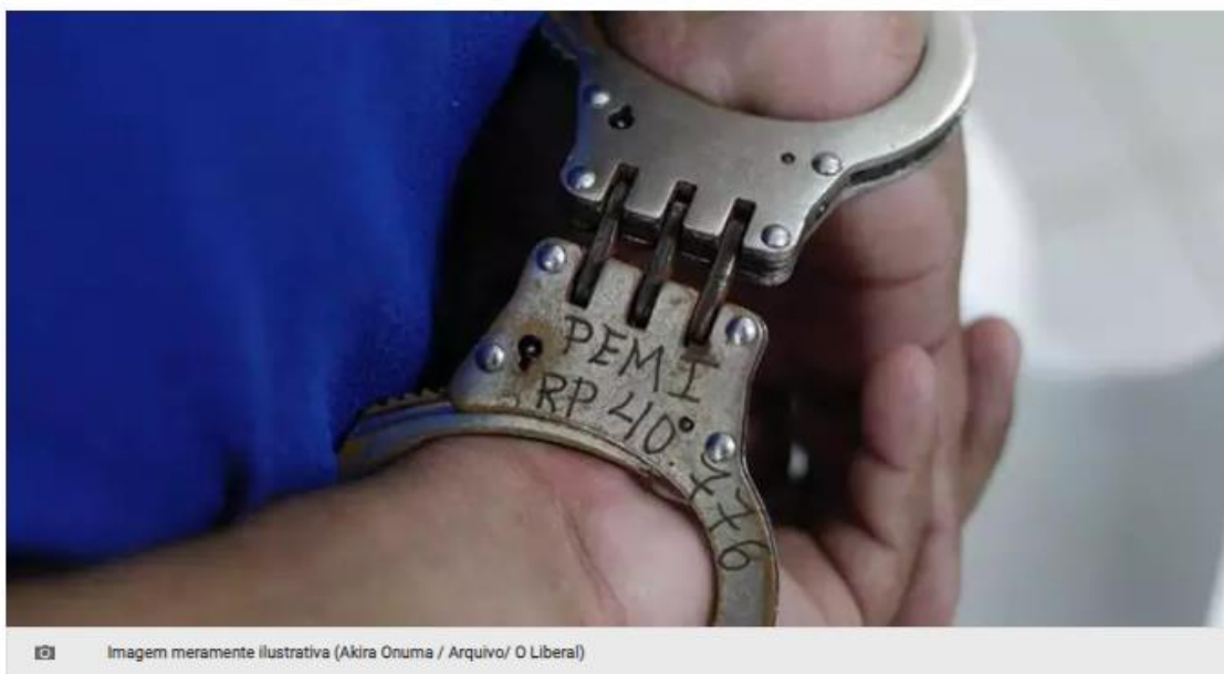
Imagem meramente ilustrativa

Quando um crime vira notícia, muitas pessoas se questionam sobre como se referir ao autor daquele determinado delito noticiado. O correto seria usar “suspeito”, “acusado” ou, até mesmo, “bandido”, como clama o senso comum? A resposta é: depende da etapa do processo jurídico. Qualquer pessoa é inocente de um crime até que se prove o contrário, de acordo com o artigo 5º da