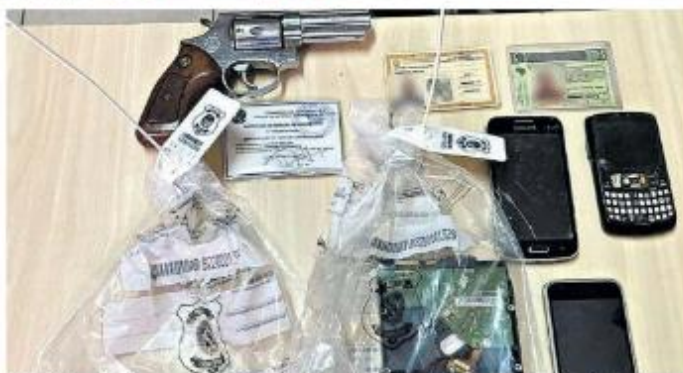
Alguns dispositivos de armazenamento de dados foram apreendidos pela equipe da Deaca na residência do suspeito