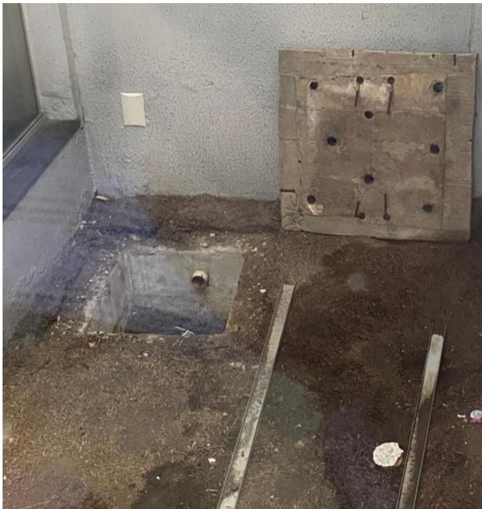
Situação de prédio temporário cedido a estudantes de escola em Ananindeua — Foto: Ascom/MPPA