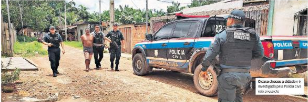
O caso chocou a cidade e é investigado pela Polícia Civil