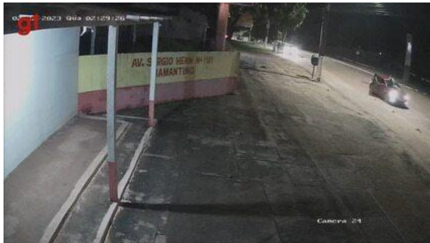
Caso Líbia: cameras de segurança registram momentos antes da morte de jovem

Após se desentenderem no bar, as jovens que estavam em carros distintos se encontraram na avenida Sérgio Henn. Líbia Tavares subiu no capô do carro conduzido por Jussara, que acelerou, conduzindo a “rival” em cima do carro por aproximadamente 350 metros. Câmeras de segurança registraram a cena ( veja abaixo ).