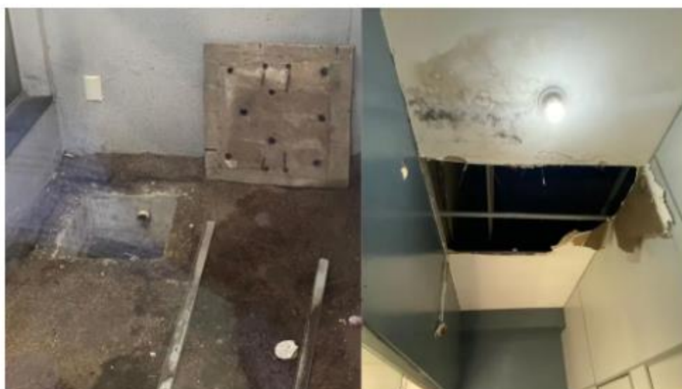
Problemas na infraestrutura são identificados em espaço temporário de escola em Ananindeua

O Ministério Público do Pará (MPPA) encontrou diversas irregularidades no espaço temporário cedido às atividades da Escola Estadual de Ensino Fundamental e Médio Armando Fajardo, no centro de Ananindeua , região metropolitana de Belém . Entre os problemas estão um esgoto aberto ao lado de uma das salas e até aberturas no teto.