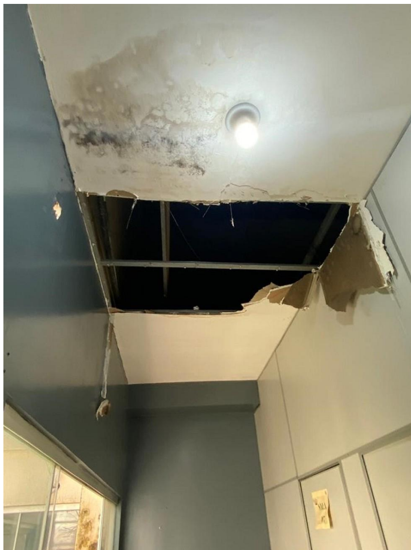
Situação de prédio temporário cedido a estudantes de escola em Ananindeua

Professores que lecionam na escola disseram que, embora tenha sido feito o remanejamento, o espaço atual é pequeno para as atividades escolares, não apresentando, por exemplo, espaço para a guarda do material de ensino, os quais ficaram no prédio anterior, sem qualquer segurança, segundo a comunidade.