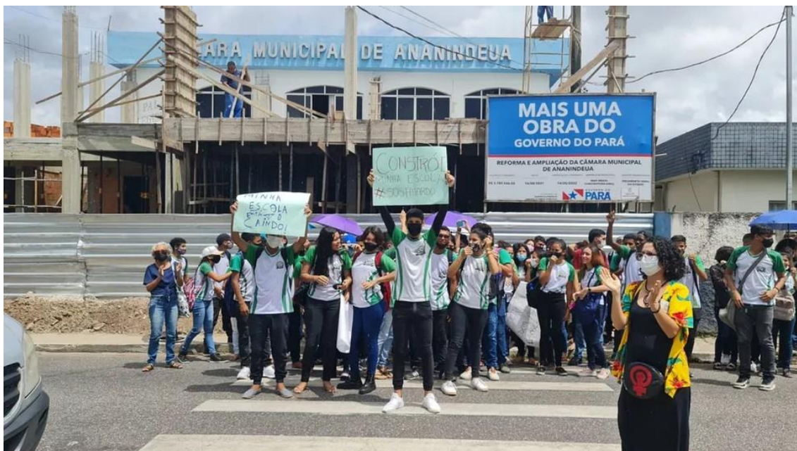
Em abril de 2022, estudantes protestaram para serem realocados de escola com risco de desabamento em Ananindeua, no PA.