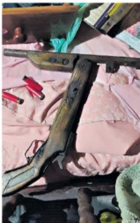
Armas e munições foram apreendidas durante os trabalhos que continuam por via aérea