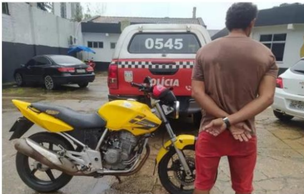
Homem foi preso na última sexta (10).

Um motociclista foi preso no conjunto Rouxinol, em Castanhal , no nordeste do Pará, dando carona para um homem procurado pela Justiça pelo crime de homicídio.