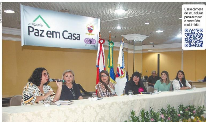
A Semana da Justiça pela Paz em Casa, promovida pelo CNJ, vai até sexta-feira

MUTIRÃO - Judiciário realiza semana em prol do Dia Internacional da Mulher, com ações que visam, entre outras coisas, agilizar os processos relacionados à violência de gênero