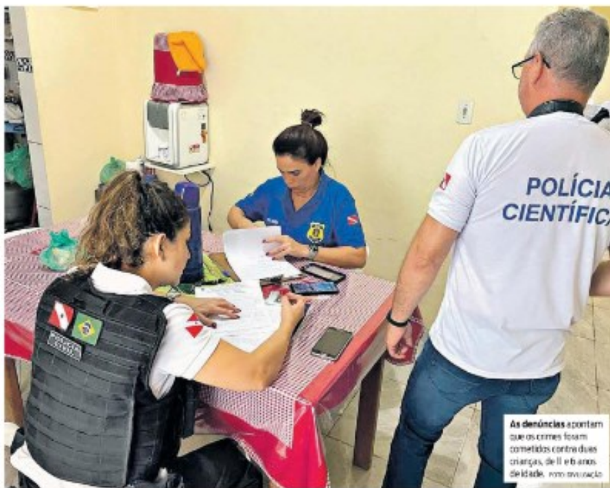
As denúncias apontam que os crimes foram cometidos contra duas crianças, de 11 e 6 anos de idade, com intenção

Integração: comece suas notícias nas redes sociais @diariodopara