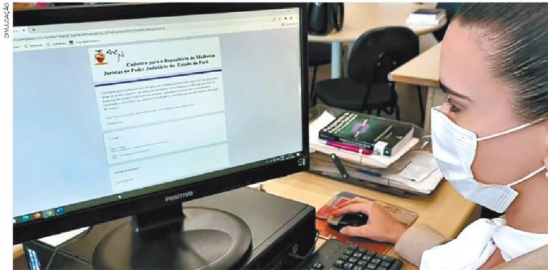
Tribunal de Justiça do Estado garante que não houve vazamento de dados após o ataque cibernético

MEDIDAS - Tribunal de Justiça do Pará informa que atendimento ao público e o expediente forense permanecem inalterados