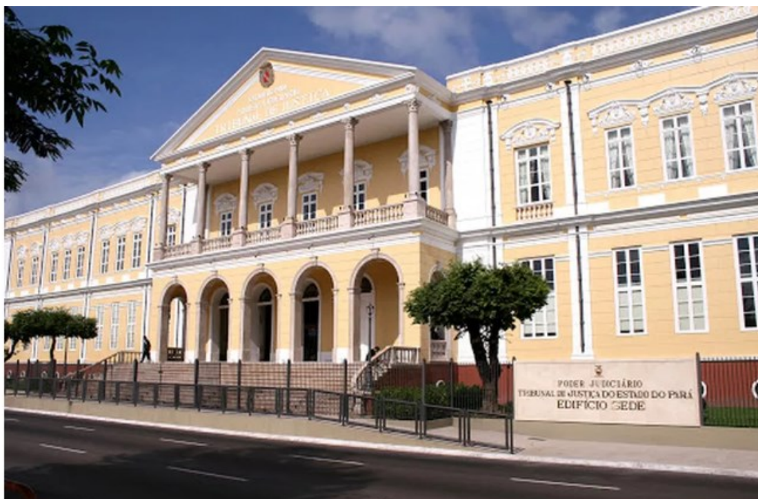
Tribunal de Justiça do Pará, em Belém

Um possível ataque cibernético no sistema do Tribunal de Justiça do Pará (TJPA) foi identificado pela rede de tecnologia da informação do local, em Belém , nesta quarta-feira (11).