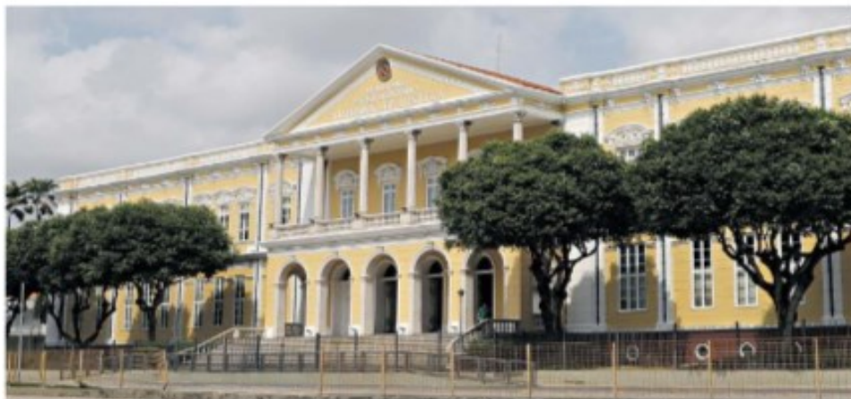
A Secretaria de Informática do TJPA agiu rápido para evitar maiores transtornos. O atendimento ao público continua sem alteração

Os serviços foram suspensos por quatro dias, como forma de precaução, para que o órgão realize “indispensáveis procedimentos de segurança”