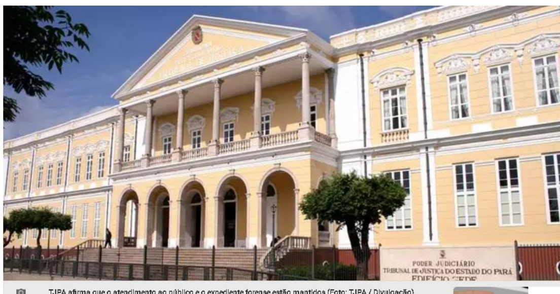
TJPA afirma que o atendimento ao público e o expediente forense estão mantidos

A rede de tecnologia da informação do Tribunal de Justiça do Pará (TJPA) identificou suposto ataque cibernético , segundo o próprio Poder Judiciário . Segundo o tribunal, os procedimentos cabíveis foram iniciados "imediatamente" pela Secretaria de Informática e não houve perda de dados , já que os principais sistemas não foram acessados , mas os serviços ficarão indisponíveis de 11 a 15 de janeiro por precaução, para procedimentos de segurança. Ao se