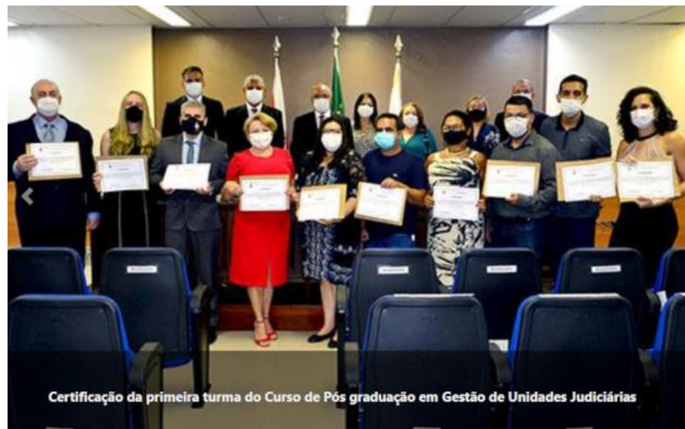
Certificação da primeira turma do Curso de Pós graduação em Gestão de Unidades Judiciárias