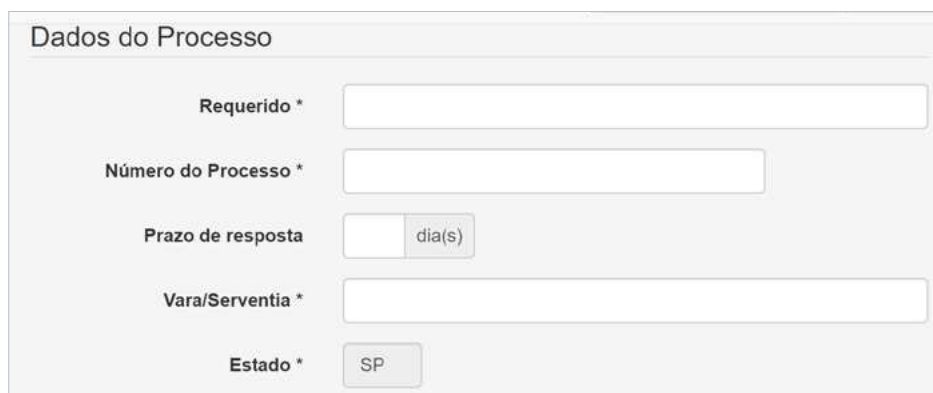
Figura 3. Dados do processo