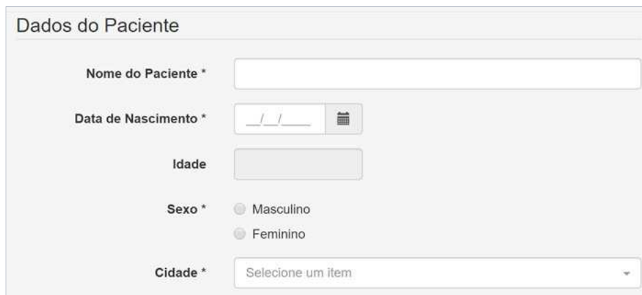
Figura 2. Dados do paciente