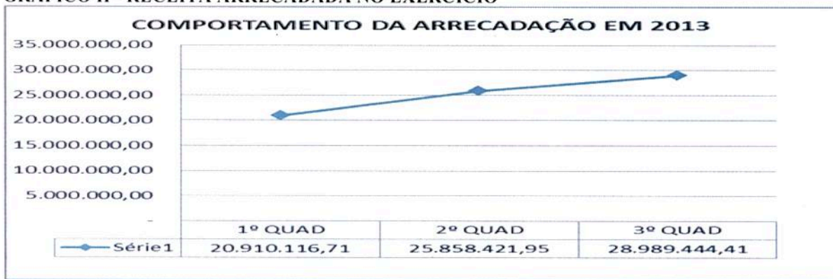
GRÁFICO II - RECEITA ARRECADADA NO EXERCÍCIO

Ao todo, no Exercício de 2013 a receita total (Janeiro/2013 a Dezembro/2013) arrecadada foi de R$ 75.757.983,07 (setenta e cinco milhões, setecentos e cinquenta e sete mil, novecentos e oitenta e três reais e sete centavos), com uma média mensal de R$ 6.313.165,26 (seis milhões, trezentos e treze mil, cento e sessenta e cinco reais e vinte e seis centavos).