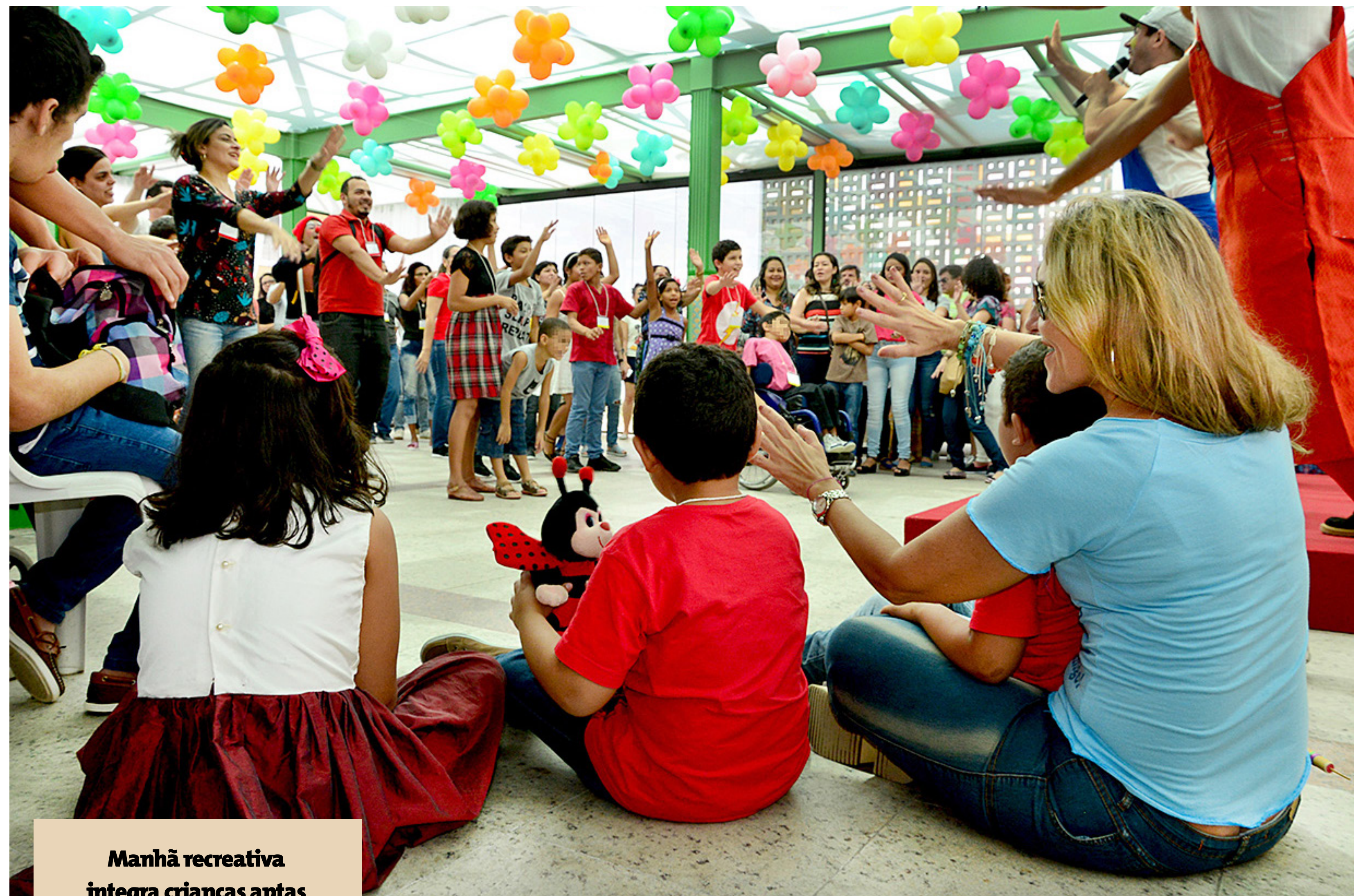
Manhã recreativa integra crianças aptas à adoção e interessados em adotar

No dia 02 de dezembro, a programação teve sequência com atividades recreativas entre as crianças e os adolescentes aptos para adoção e os pretendentes a pais, no Gazebo do Edifício Sede, do TJPA. Por meio de atividades lúdicas com palhaços e animadores, além da roda de dança circular, 16 crianças, 14 adolescentes e 80 pretendentes a pais por adoção e seus familiares compartilharam suas histórias de vida, seus afetos e suas alegrias.