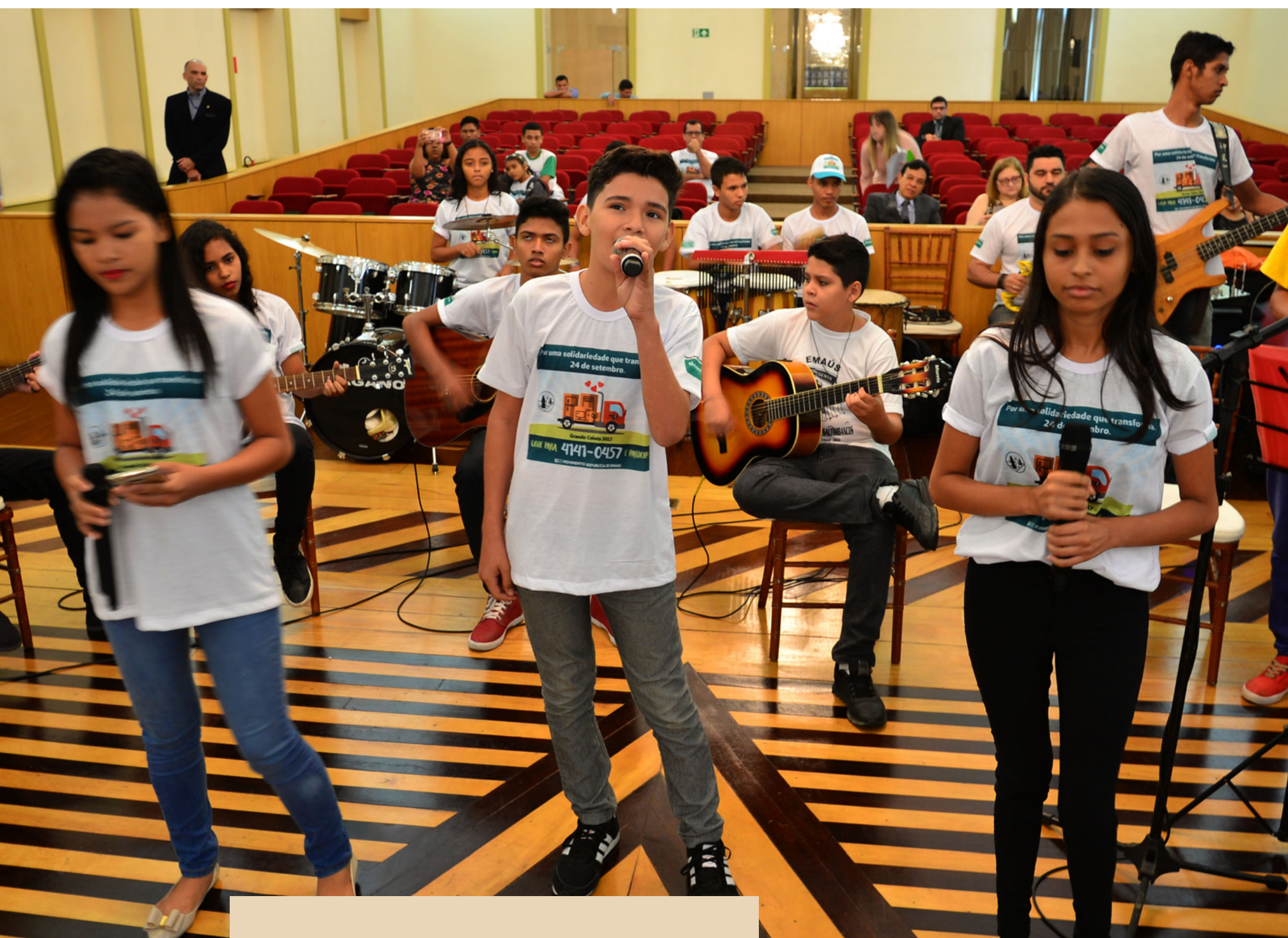
Crianças fazem apresentação musical durante evento que reuniu magistrados de 17 Estados e do DF