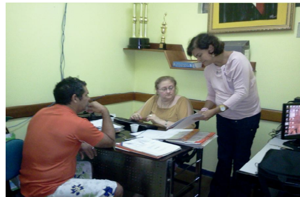
Mutirão em Altamira