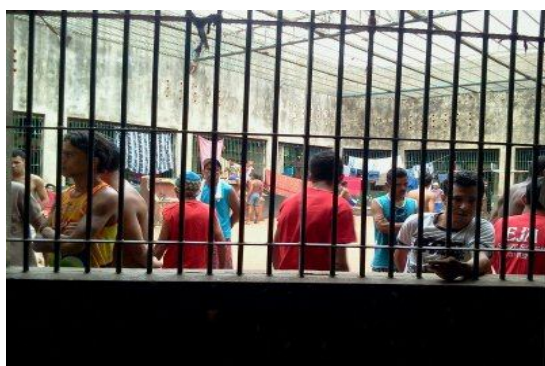
Inspeção Carcerária em Tucuruí