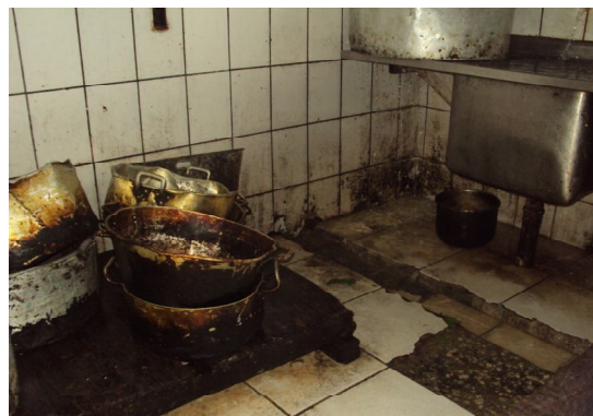
Inspeção na Cozinha do PEM I