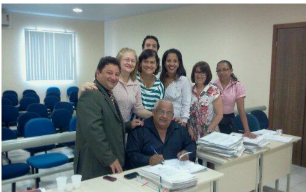
Mutirão em Redenção