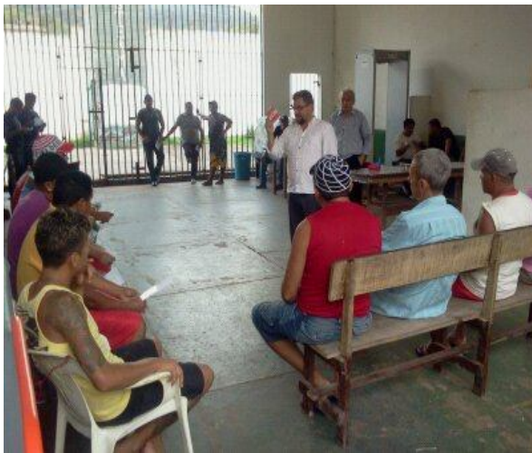
Mutirão Carcerário em Santarém