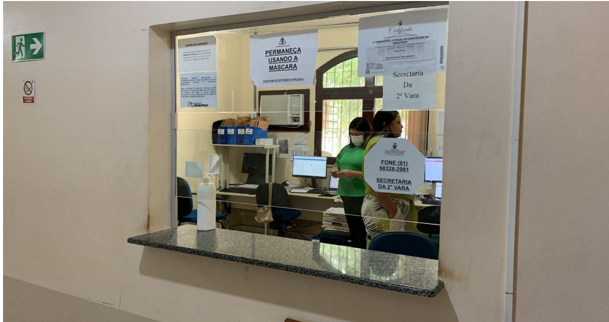
Vista externa do balcão de atendimento da 2ª Vara