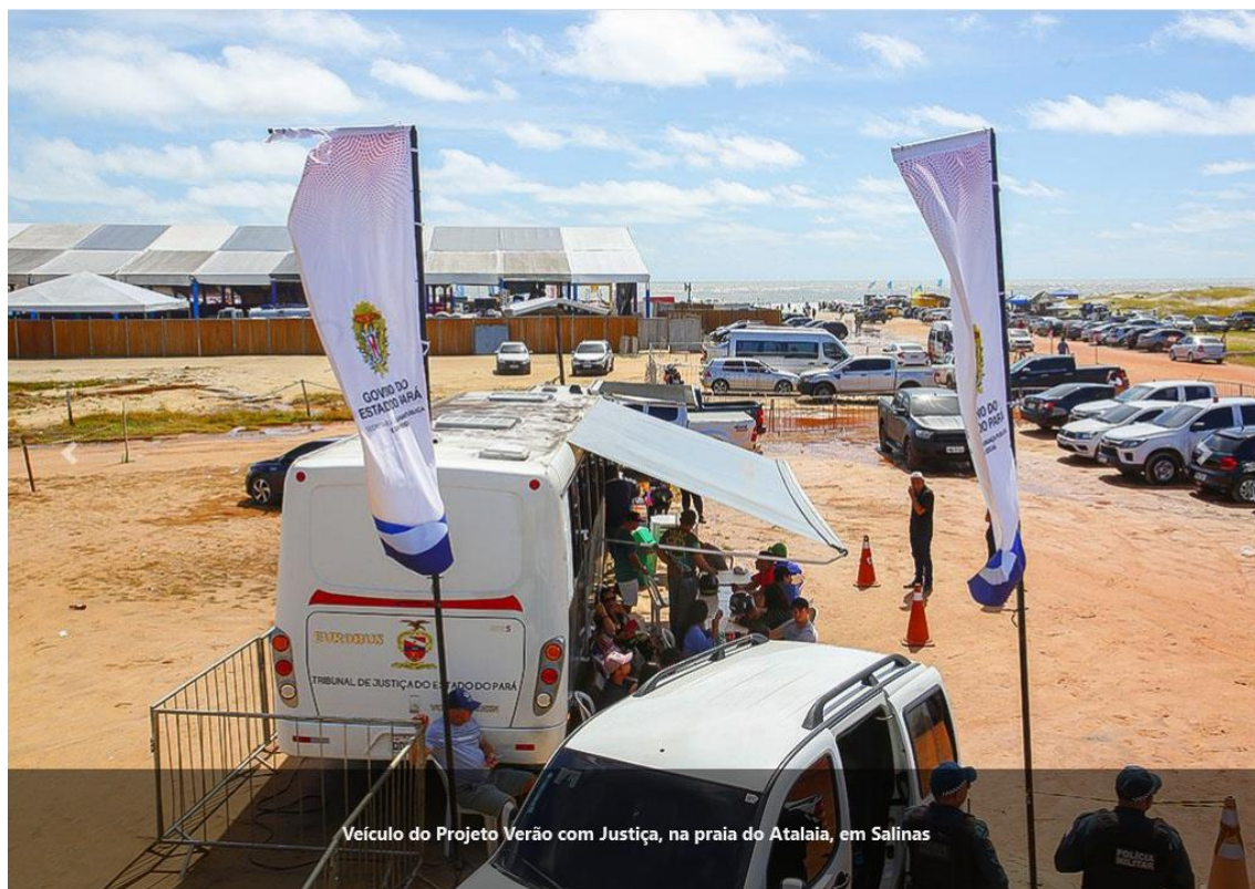
Veículo do Projeto Verão com Justiça, na praia do Atalaia, em Salinas

Nos dois dias, o Tribunal Regional Eleitoral do Pará (TRE) realizou 357 atendimentos de orientação a eleitores e eleitoras nas questões relacionadas ao pleito eleitoral de 2022; o Balcão de Direitos da Defensoria Pública realizou 375 atendimentos junto à Polícia Civil, com emissão de 135 carteiras de identidade; a Fundação ParáPaz realizou 217 atendimentos de acolhimento psicossocial e disponibilizou atividades recreativas e esportivas para crianças e adolescentes, ações de prevenção e orientação sobre pautas como o combate ao abuso e exploração sexual de crianças e adolescentes, por meio de atividades pedagógicas. Além desses(as) parceiros(as) o Ministério Público estadual participou do projeto durante as audiências.