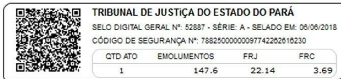
Imagem Exemplo do Selo