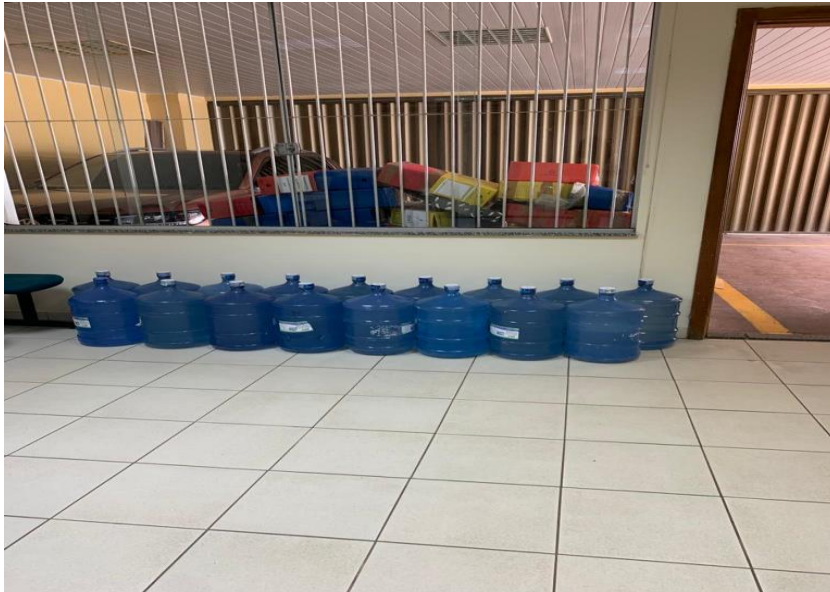
Garraões de água e mobília deixados no corredor.

ANEXO V – Relatório de Carga – tela inicial do Sistema LIBRA ANEXO VI - Relatório Fiscalização SEPLAN ANEXO VII – Relatório de Objetos extraído do sistema LIBRA ANEXO VIII- ACERVO DE FOTOS