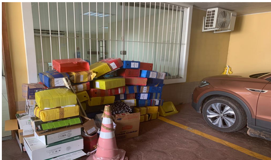
caixas-archivo entulhadas na garagem