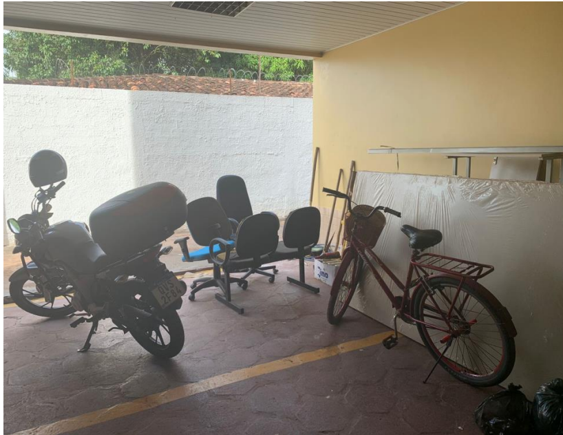
Mobiliários com defeito