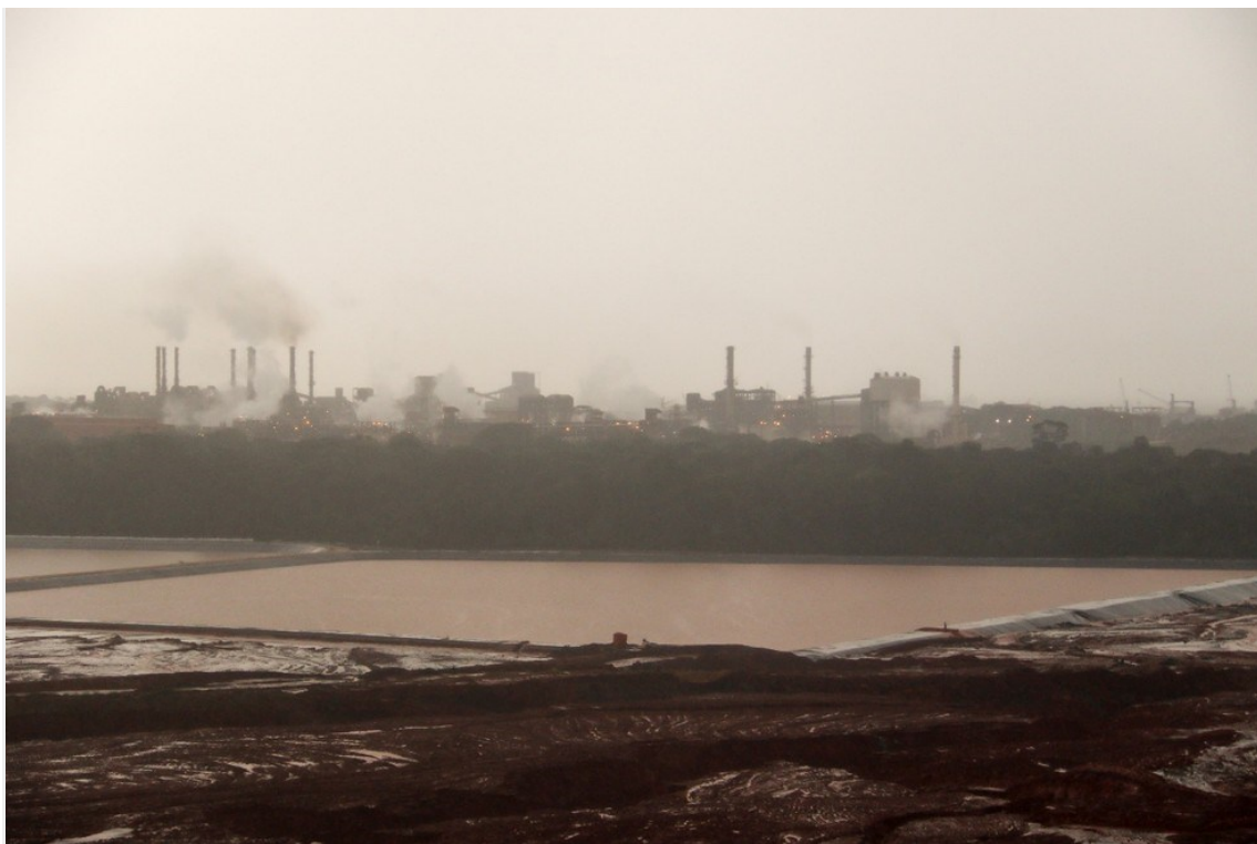
Hydro Alunorte em Barcarena Pará