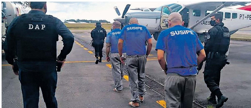
Os acusados que permanecem no Pará em breve terão o mesmo destino. Atualmente, eles estão apenas no aguardo dos trâmites burocráticos para posteriormente serem levados a cadeias federais

Promotores de Justiça ofereceram duas denúncias criminais contra 11 integrantes do alto escalão da facção criminosa atuante no Pará. A maior parte deles já teve sua transferência do Estado para presídios federais