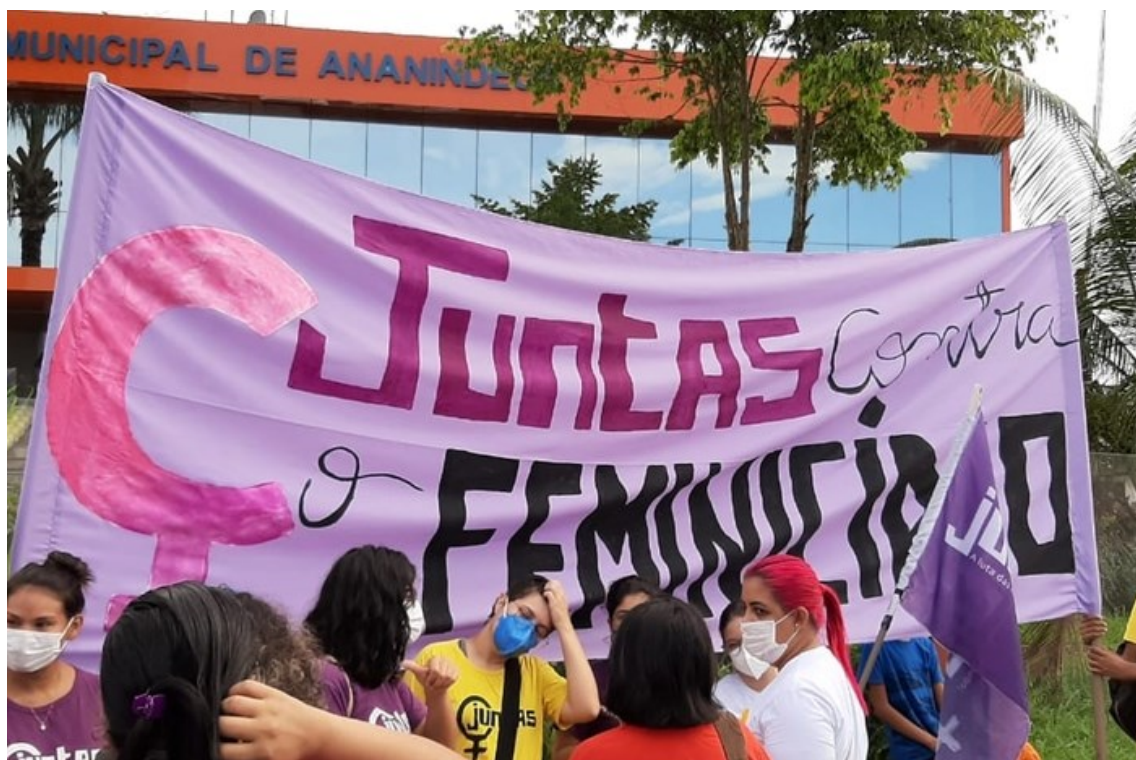
Ato em Ananindeua