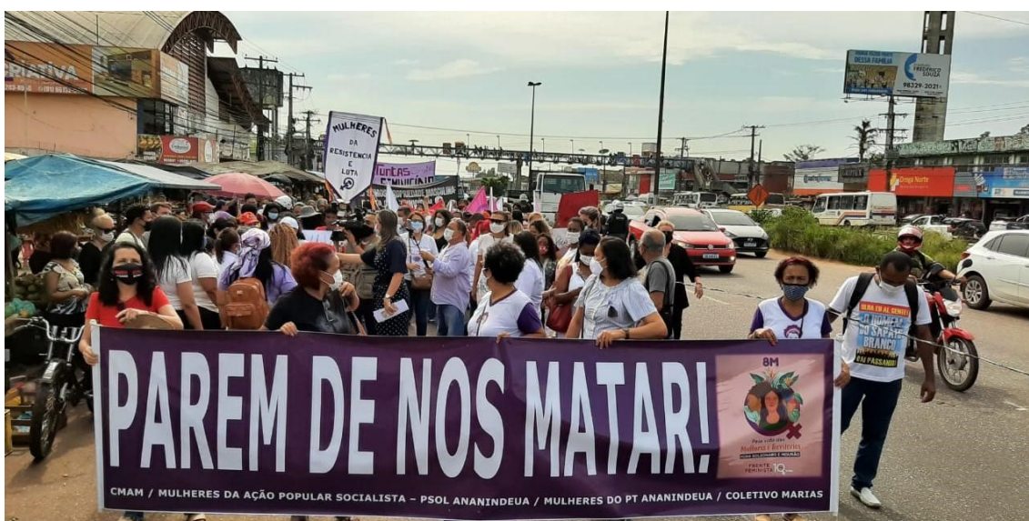
Protesto pela rodovia BR-316