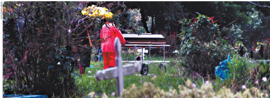
A família de Geordana pediu privacidade e o acesso à imprensa foi limitado